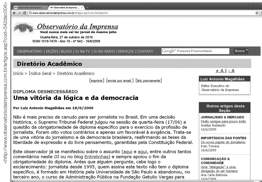
O texto sobre a decisão do STF.

Utilizamos para isso tanto os textos publicados no site como os comentários deixados pelos usuários às matérias e artigos. Por meio desses comentários nos foi possível extrair o que pensam os leitores sobre a proposta do OI , bem como a dinâmica de construção da crítica à imprensa, suas percepções da necessidade de um espaço de crítica e do que este exercício pode trazer às pessoas. Recorremos para análise todos os comentários sobre a decisão do STF no período de uma semana, totalizando 44 postagens aos 71 artigos publicados.