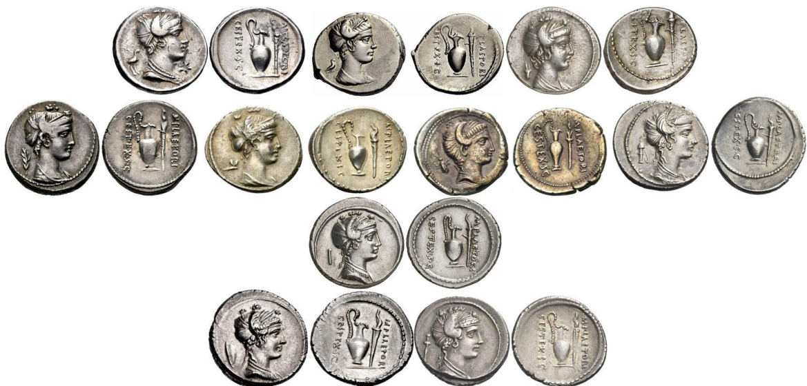
Variantes de RRC 405/4b