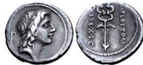
Denario forrado RRC 405/5 131

Un dato a señalar es que el número de cuños de la variante RRC 405/5, en la que se representaría a Mercurio, es mayor (ligeramente) al resto de variedades. Con ello se ha querido indicar la importancia que se daba a esta variante, de forma que haría alusión a la adjudicación de la cura annonae a Pompeyo y al esperado fortalecimiento del comercio (representado de manera inequívoca por Mercurio) 130 .