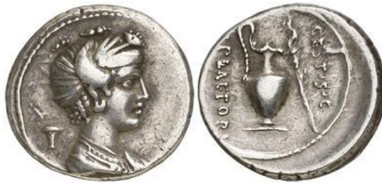
Denario RRC 405/4a (ampliado x 2)

En cuanto a la tipología de los denarios RRC 405/3-5, como señala M. Hollstein, es de más difícil interpretación, aunque forman un conjunto unitario 93 .