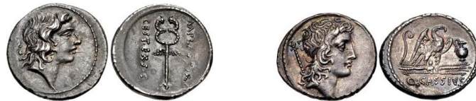
Denarios RRC 405/5 y RRC 428/3 respectivamente

Según M. Hollstein, es preferible la fecha del año 57 a.C. para la presente amonedación por las siguientes causas: 1) el análisis del tesoro de Messagne sugiere una datación tardía para la emisión RRC 405; 2) las diferencias en la fabricación y el estilo de los dos grupos de denarios RRC 405 y RRC 409, que se pueden fechar con certeza en el año 67 a.C., indica una mayor diferencia en el tiempo de lo que en su día defendió M. H. Crawford, que fechó nuestra serie en el año 69 a.C.; 3) es inconfundible una similitud estilística entre las dos cabezas de RRC 405/5 y RRC 428/3 (datada esta amonedación en el año 55 a.C.) respectivamente 24 .