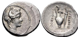
RRC 405/4c. AR. Denario.