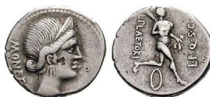
Denario RRC 396/1b