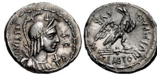
Denario RRC 409/1

Según M. Hollstein, es preferible la fecha del año 57 a.C. para la presente amonedación por las siguientes causas: 1) el análisis del tesoro de Messagne sugiere una datación tardía para la emisión RRC 405; 2) las diferencias en la fabricación y el estilo de los dos grupos de denarios RRC 405 y RRC 409, que se pueden fechar con certeza en el año 67 a.C., indica una mayor diferencia en el tiempo de lo que en su día defendió M. H. Crawford, que fechó nuestra serie en el año 69 a.C.; 3) es inconfundible una similitud estilística entre las dos cabezas de RRC 405/5 y RRC 428/3 (datada esta amonedación en el año 55 a.C.) respectivamente 24 .