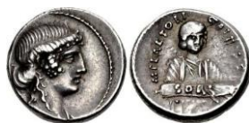
RRC 405/2. AR. Denario.

El praenomen y el nomen del monetario aparecen de las siguientes formas: M· PLAETORIVS (BMCRR Rome 3519), M· PLAETORIV (BMCRR Rome 3520) 30 , M· PLAETORI (BMCRR Rome 3521), M· PLAETORI (Paris, A 13961), M· PLAETOR (BMCRR Rome 3523), M· PLAETOR (de E. Babelon) 31 .