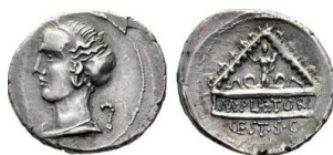
RRC 405/1b. AR. Denario.

Anv.: Similar, pero, detrás, marca de control.