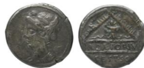
RRC 405/1a. AR. Denario.