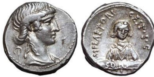
Denario RRC 405/2 (ampliado x 2)

En cuanto a RRC 405/2, presenta en el anverso un busto de mujer, que M. H. Crawford de manera tentativa identifica con la diosa Fortuna (de hecho, la Fortuna Primigenia ), teoría que previamente había sido defendido por otros investigadores 69 , aunque también se ha propuesto que representase a la Fortuna Populi Romani 70 . En el reverso aparece una figura de medio cuerpo de un niño mirando (el camillus ), sosteniendo una tablilla inscrita SORS. El conjunto parece representar un oráculo en funcionamiento 71 , en referencia al oráculo de Praeneste , el más famoso de Italia que se realizaba echando suertes: las Sortes Praenestinae (de ahí la aparición de la leyenda SORS) (CIL XIV 2862. ILLRP 101-110. Cic. de div. 2, 85-87, cf. 1, 34. Tibull. 1, 3, 11. Val. Max. 1, 3, 1) 72 . Es precisamente de la interpretación de esta moneda por la que se ha inferido que nuestro magistrado era miembro de la gens Cestia de Praeneste , que sería adoptado por un integrante de la gens Plaetoria de Tusculum , vid supra . De aquí, que tengamos en el anverso la presencia de la Fortuna Primigenia , la deidad más importante de Praeneste .