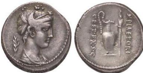
Denario RRC 405/4b (ampliado x 2)