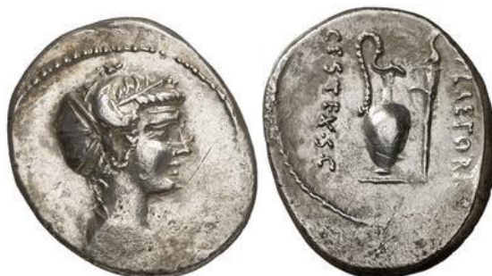
Denario RRC 405/4c (ampliado x 2)