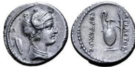
RRC 405/4b. AR. Denario.

Rev.: Jarra y antorcha; a izq., M·PLAETORI hacia abajo; a dra., CEST·S·C hacia abajo. Grafila de puntos.