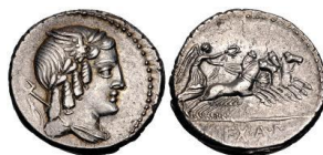
Denario RRC 352/1b

La emisión RRC 405 fue producida en Roma, aunque los investigadores difieren sobre su fecha de acuñación, puesto que su producción se encuentra en el periodo más difícil de organizar desde el punto de vista cronológico de la amonedación republicana 1 . Una primera aproximación la puede ofrecer un denario RRC 405/5 reaçuñado sobre un denario de L. Bursio (RRC 352/1) (Hersh 73) 2 , datada actualmente en el año 84 a.C. Por tanto, nuestra serie ha de ser posterior a esta fecha.