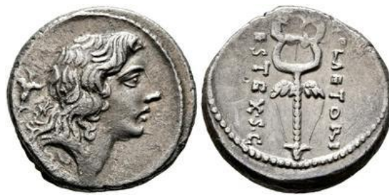
Denario RRC 405/5 (ampliado x 2)