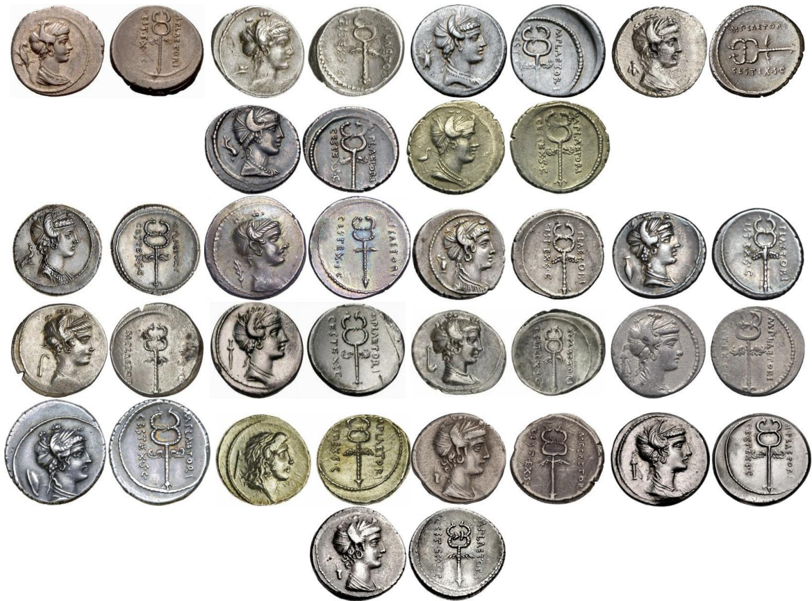
Variantes de RRC 405/3b