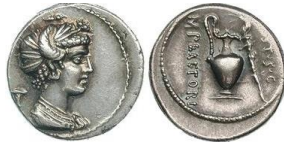
RRC 405/4a. AR. Denario.