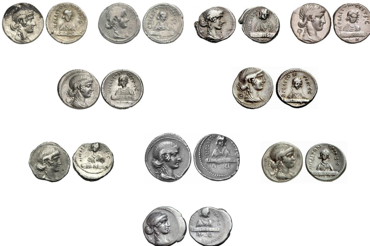
Variantes de RRC 405/2

Tabla de marcas de control de RRC 405/2 según M. H. Crawford (las marcas de control, si no se menciona alternativa, proceden de París)