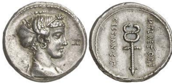
Denario RRC 405/3a (ampliado x 2)