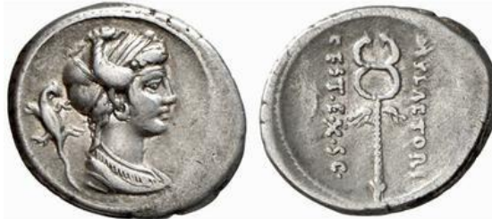
Denario RRC 405/3b (ampliado x 2)

En cuanto a la tipología de los denarios RRC 405/3-5, como señala M. Hollstein, es de más difícil interpretación, aunque forman un conjunto unitario 93 .