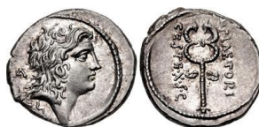
RRC 405/5. AR. Denario.

La leyenda de un cuño de reverso de RRC 405/4b es M·PLAETOR·CEST·EX·S·C (BMCR Rome 3541) 41 .