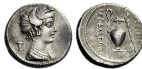
Variantes de RRC 405/4a