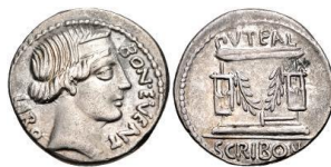
Denario RRC 416/1a

Igualmente, en clave local, se ha relacionado esta imagen con Erilo, hijo de Feronia y rey de Praeneste , que tenía tres almas y tres pares de brazos (únicamente documentado en Virg. Aen. 8, 450-467), o con Ceculo, hijo de Vulcano, fundador mítico de Praeneste (Virg. Aen. 7, 678-681) 118 , de quien parece que la gens Caesia decía descender 119 .