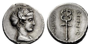
RRC 405/3a. AR. Denario.