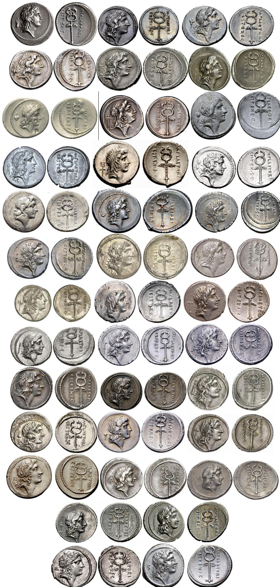
Variantes de RRC 405/5