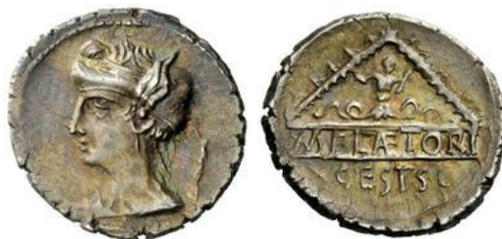
Denario RRC 405/1b (ampliado x 2)

denomina strategos en una inscripción de Delfos [SEG I 165]), y puede ser el mismo M. Plaetorius que sirvió bajo P. Cornelio Léntulo Espínter ( cos. 57 a.C.) en Cilicia en el año 55 a.C. ( Cic. Fam. 1, 8, 1), aunque se desconoce cuál sería su cargo 60 . Si es el Pletorio mencionado por Cicerón en el año 56 a.C. ( Cic. Fam. 1, 8, 1) 61 , estaría relacionado estrechamente con Cn. Pompeyo Magno ( cos. I 70 a.C.) 62 .