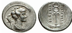
RRC 405/3b. AR. Denario.

Anv.: Similar, pero detrás, marca de control.