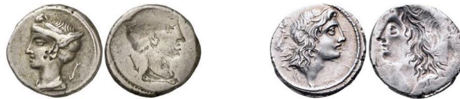
Denarios incusos RRC 405/1b 48