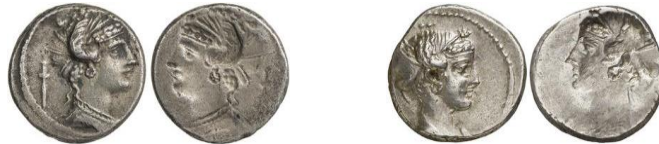
Denarios incusos RRC 405/3 49

El monetario es M. Plaetorius M. f. Cestianus (pr. 64 a.C. 50 ), el miembro mejor documentado de su gens , originaria (Cf. CIL I 2 1442 = CIL XIV 2648 = ILLRP 689 = ILS 6206. CIL I 2 1443 = ILLRP 59 = EE IX 697 = ILS 6214) 51 de la ciudad latina de Tusculum , actualmente en ruinas, aunque la fecha de las magistraturas que ejerció no está exenta de problemas de tipo cronológico. Quizás fuera el hijo de M. Pletorio, seguramente un senador, muerto por L. Cornelio Sila ( cos. I 88 a.C.) en el año 82 a.C. (Val. Max. 9, 2, 1) 52 . Al parecer, nuestro monetario era un miembro de la gens Cestia originaria de la ciudad latina de Praeneste (Palestrina, ciudad metropolitana de Roma), que fue adoptado por un miembro de la familia Plaetoria 53 .