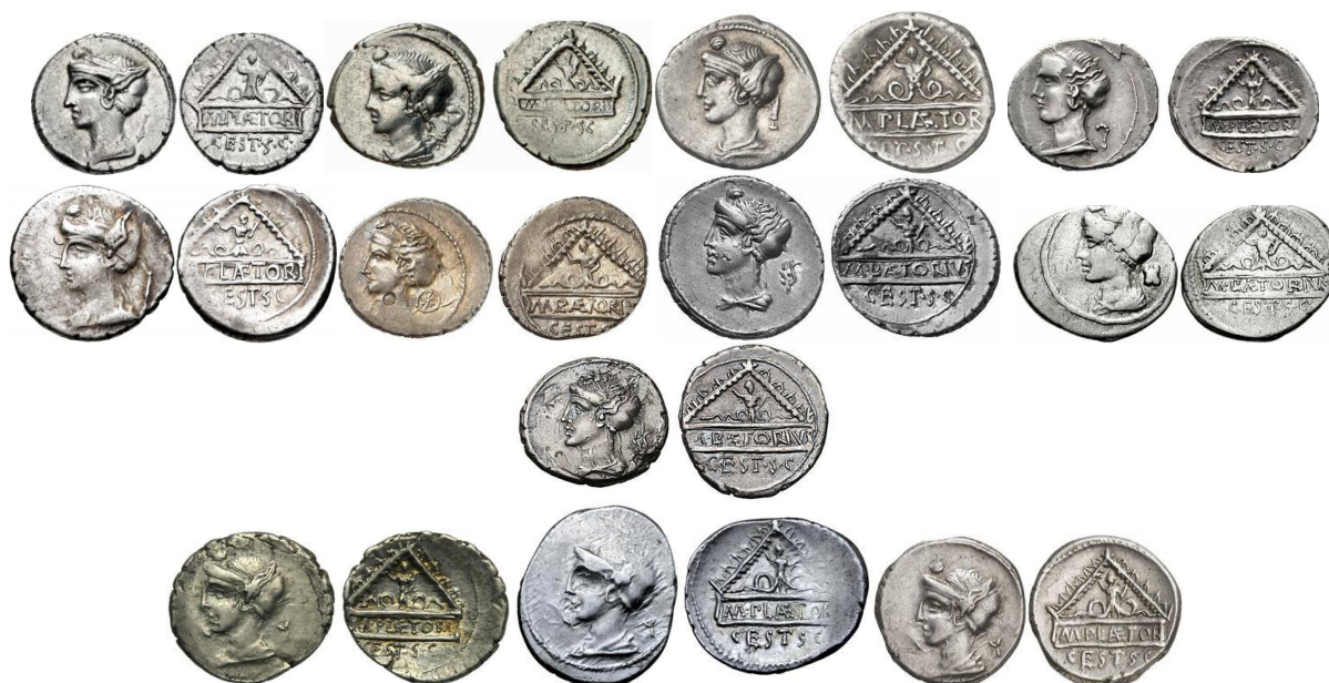
Variantes de RRC 405/1b

Tabla de marcas de control de RRC 405/1b según M. H. Crawford (las marcas de control, si no se menciona alternativa, proceden de París)