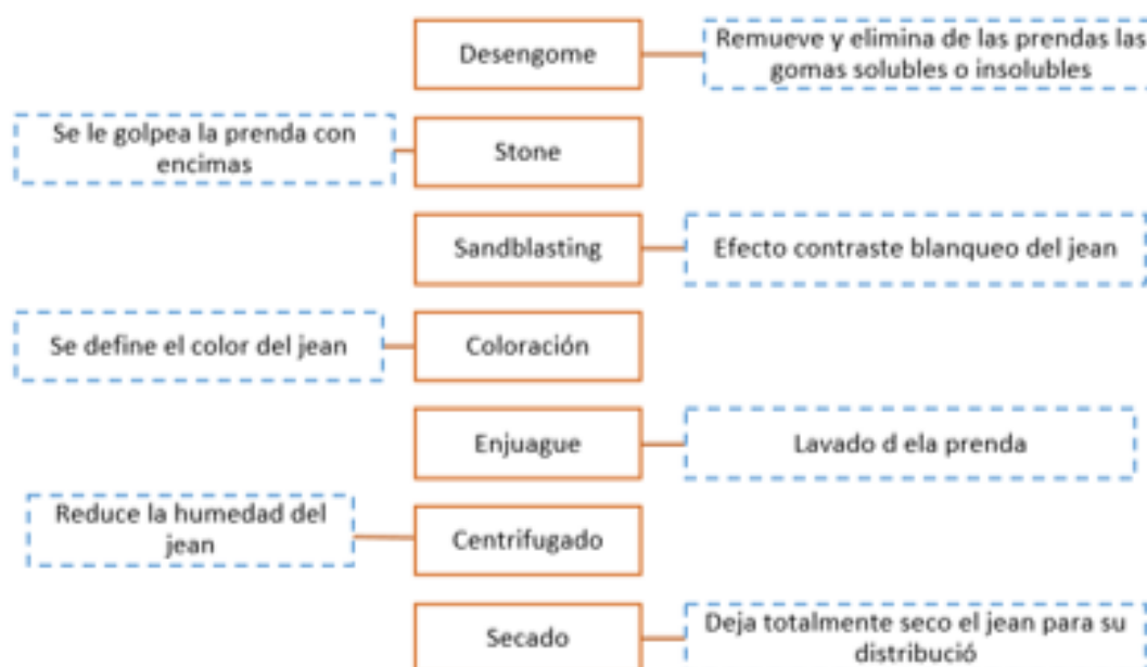
Figura 1. Diagrama de flujo de proceso de lavado y tinturado del jean

A partir de la información primaria obtenida mediante las encuestas realizadas a los gerentes o representantes de las lavanderías y tintorerías de jean se pudo identificar los procesos del lavado y tinturado del jean identificando los insumos y recursos utilizados dentro de cada proceso. En la figura 1 se presenta un diagrama del proceso de lavado y tinturado del jean.