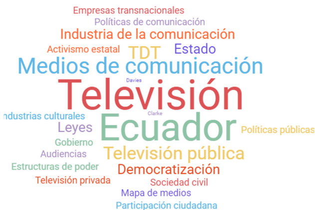
Gráfico 2. Nube de palabras clave de los artículos sobre televisión ecuatoriana

Para responder a la pregunta de qué se investigó, la visualización de las palabras clave más utilizadas en las publicaciones científicas fue importante (Gráfico 2). Alrededor de las palabras de búsqueda, destacaron: televisión con nueve registros, Ecuador con ocho, medios de comunicación con cuatro, televisión pública y democratización con tres, respectivamente.