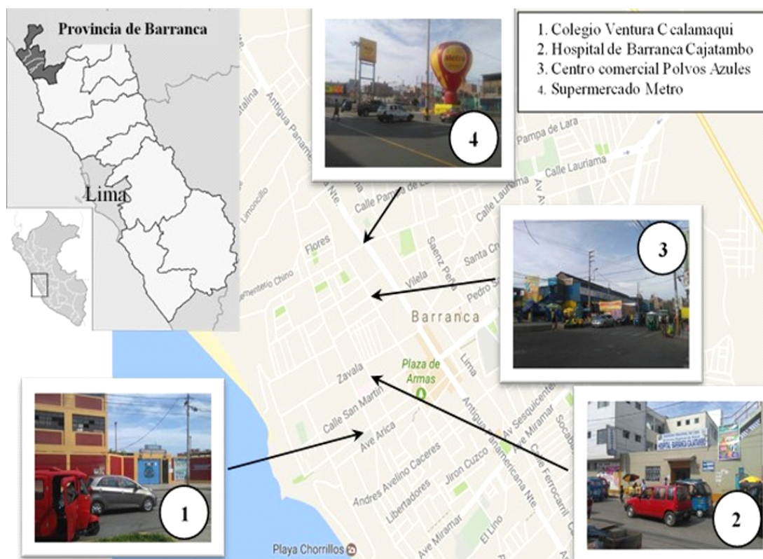
Figura 1: Mapa de zonas donde se realizó el monitoreo del sonido a diferentes horas del día. La imagen global se obtuvo de Google maps

importantes para el estudio (Tabla 1), la investigación se llevó a cabo por seis meses durante el año 2019, los datos se registraron con un equipo sonómetro Center 390 Data Logger Sound Level los días laborales de lunes a viernes a horas 7 a.m., 10 a.m., 1 p.m. y 3 p.m.,