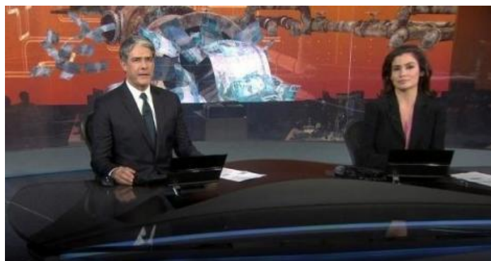
Figura 2: Os apresentadores William Bonner e Renata Vasconcellos na edição do dia 2 de outubro de 2018 do Jornal Nacional .