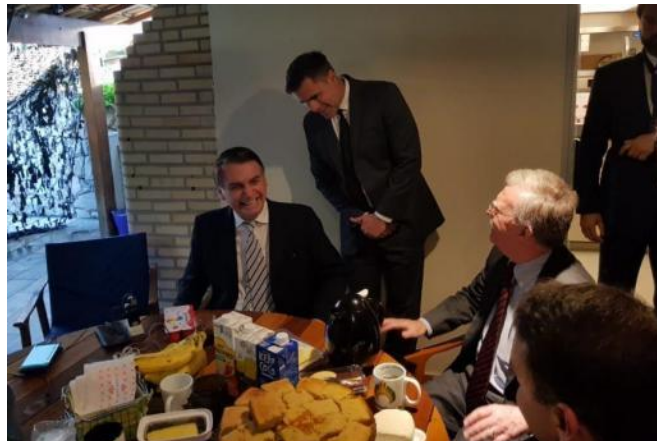
Figura 6: Bolsonaro recebe assessor de Trump para café da manhã.