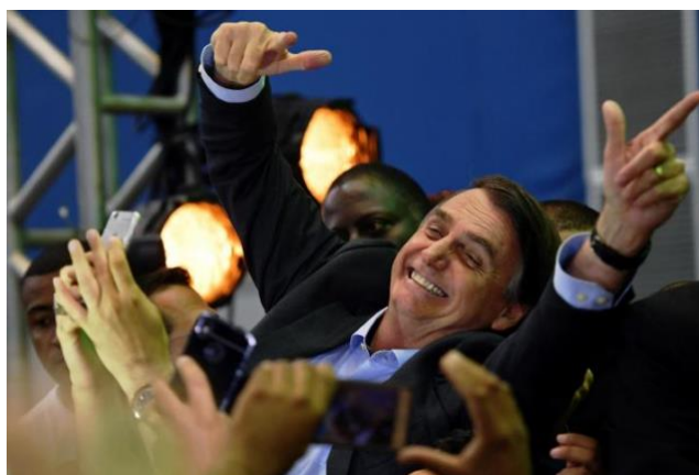
Figura 7: Cena da convenção do PSL que indicou Bolsonaro como candidato.