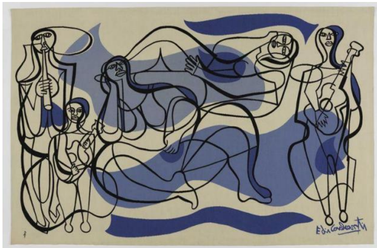
Figura 10: Imagem da tapeçaria Os músicos , do pintor modernista Di Cavalcanti.