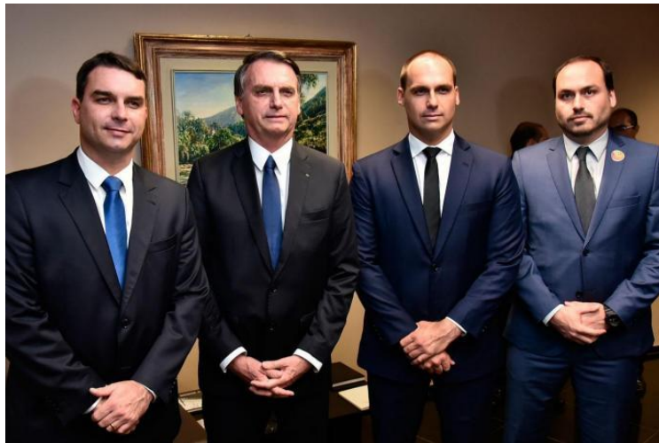
Figura 3: Bolsonaro e seus filhos no dia da posse presidencial.