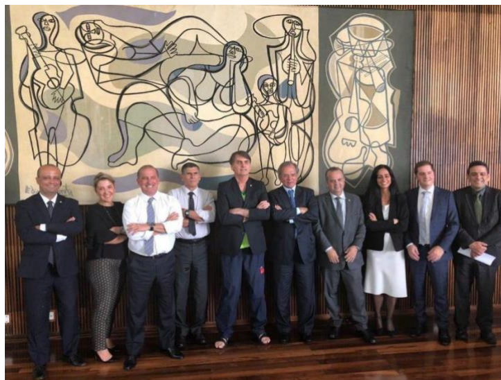
Figura 9: Na reunião com ministros, o presidente aparece de chinelo, calça de prática esportiva e camisa de time de futebol encoberta por um paletó emprestado.