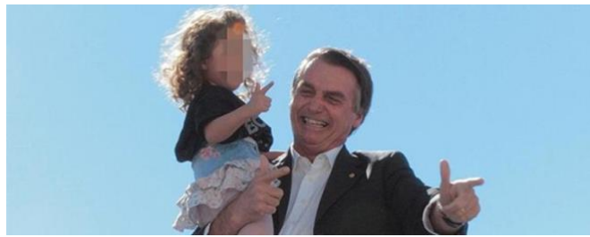
Figura 8: Cena de campanha na cidade de Goiânia, centro do Brasil, em que o candidato ensina uma criança a fazer o sinal de arma.