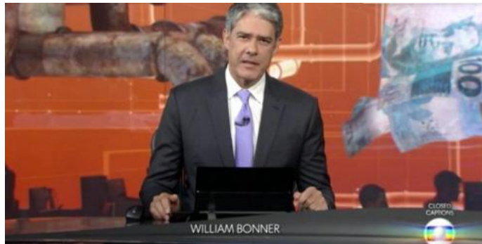
Figura 1: O apresentador William Bonner na edição do dia 5 de abril de 2018, do Jornal Nacional .