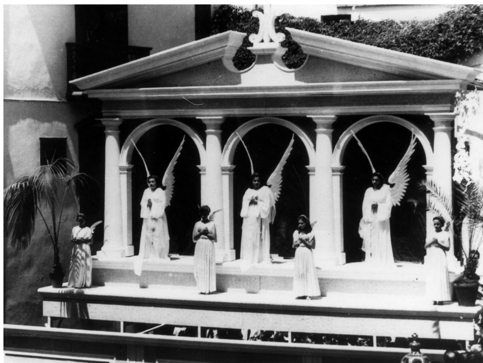
Loa de Recibimiento (1955). AGLP

la ejecución de este acto, el más emotivo de las fiestas lustrales.