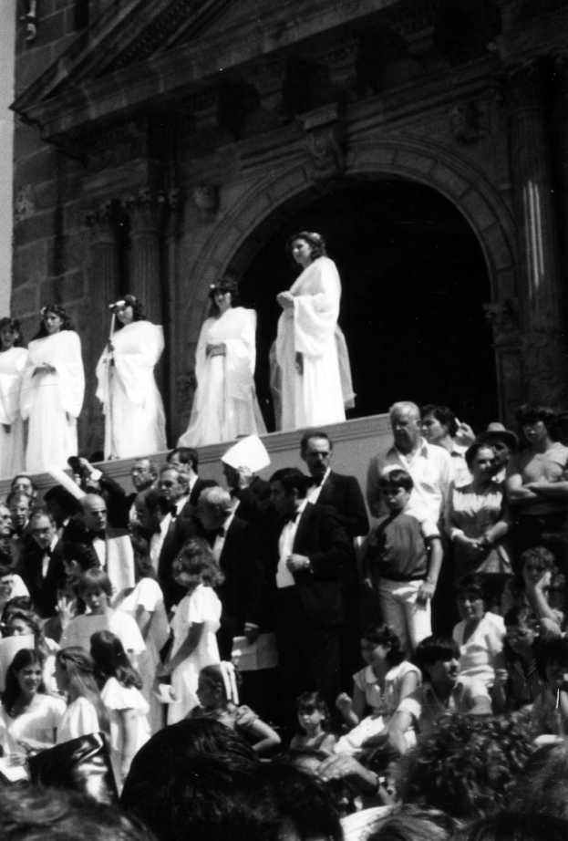
Loa de Recibimiento (1980). AGLP

momento culmen de la Bajada de la Virgen, en la plaza de España; al finalizar, la Virgen entraría en la parroquia matriz de El Salvador y no habría misa en ese momento, sino por la tarde, que sería interpretada por la Orquesta Sinfónica de Tenerife, el coro adulto y las voces solistas de la Escuela Insular de Música.