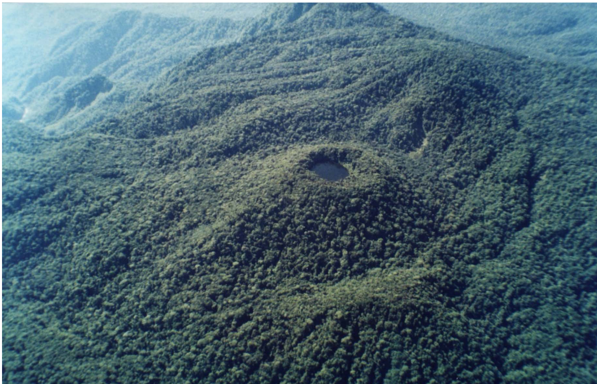
Figura 2. Vegetación en la cima y las estribaciones del volcán Barva. Figure 2. Vegetation on the top and foothills of the Barva volcano.

Hasta hoy, a 134 años de distancia, aquella propuesta de Pittier, acogida con tanta presteza por las dirigencias políticas —siempre atentas a sus sopesados y constructivos consejos—, ha permitido que esa extensa área montañosa, además de embellecer la de por sí hermosa cima del volcán Barva ( Figura 2 ), siga suministrando el agua que demanda una inmensa porción del Valle Central. Este hecho, por sí solo, inmortaliza a Pittier en nuestra sociedad.