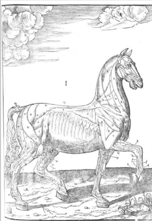
Musculatura del Caballo. Carlo Ruini 1598