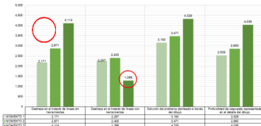
Tabla de resultados de competencias y habilidades para la resolución de problemas a través del dibujo arquitectónico a mano alzada.