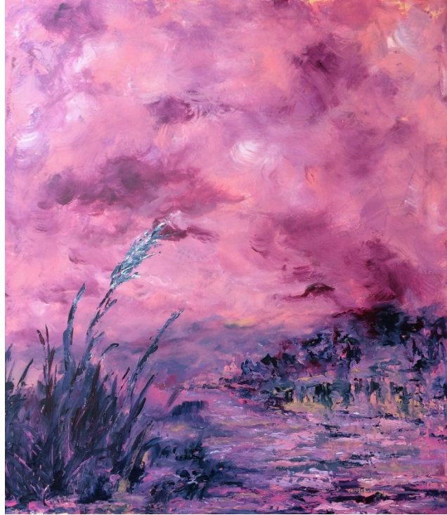
Valle púrpura , acrílico. Carola Ferrero Alonso

El artículo es resultado del Proyecto de investigación: “Las prácticas docentes universitarias con base en las inteligencias múltiples para el desarrollo de la creatividad académica”, código: INV-HUM-3477, financiado por la Vicerrectoría de Investigaciones de la Universidad Militar Nueva Granada.