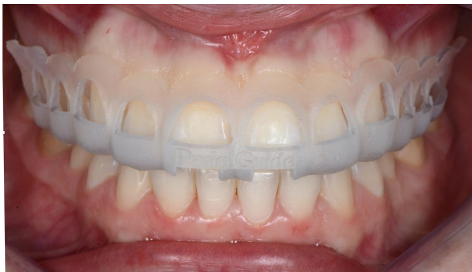
Imagen 4. Guía quirúrgica confeccionada con base en el diagnóstico clínico y digital previamente realizado

ser un complemento de la información proporcionada por la tomografía para la confección de un diseño digital y también de guías. 11,13