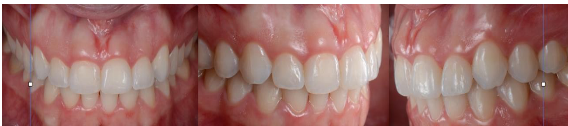
Imagen 2. Análisis intraoral para diagnóstico

Con relación a los procedimientos a ser usados para la corrección de defectos gingivales, tenemos procedimientos regenerativos, usados generalmente en casos de defectos del tejido blando que necesitarán ser reconstruidos y también procedimientos respectivos, que a su vez permiten remover tejidos patológicos y remodelar tejidos en exceso para mejorar su apariencia. 3