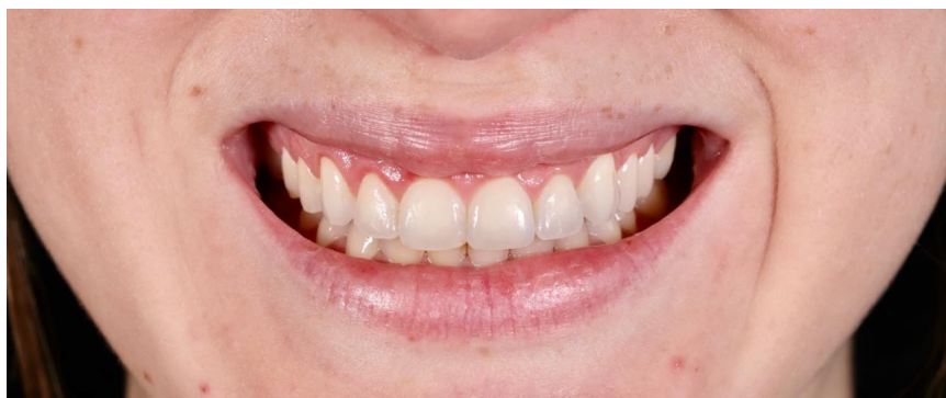
Imagen 10. Fotografía final posoperatoria, seis meses después del procedimiento

Para el procedimiento quirúrgico fue necesario el posicionamiento de la guía para verificar su adaptación, y con base en ésta comenzar a realizar las incisiones de la gingivectomía. En este caso en particular, el uso de la guía nos permite tener un apoyo para la primera incisión en la cual la lámina de bisturí 15c estará guiada por el arco inferior de la guía que indica el nivel en el cual estableceremos el nuevo margen gingival. Así repetimos este procedimiento en todos los dientes a ser tratados (ver Imagen 5).