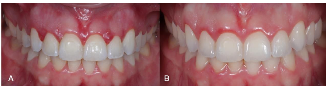
Imagen 9. Acompañamiento posoperatorio de 15 días (A) y 6 meses (B)