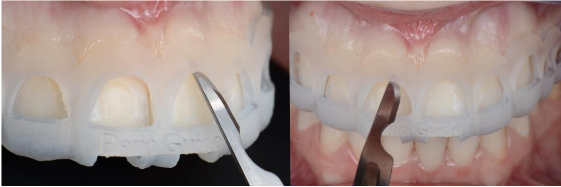
Imagen 5. Primera incisión ejecutada apoyando la lámina 15c en el primer arco de la guía