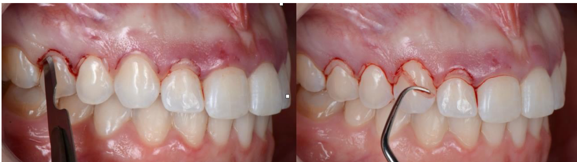
Imagen 6. Remoción del margen gingival después de la segunda incisión intrasulcular