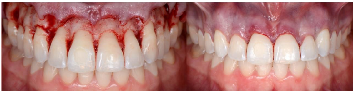
Imagen 8. Reposicionamiento del colgajo y sutura final