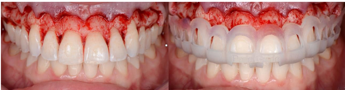
Imagen 7. Elevación de colgajo de espesor total y uso de la guía para osteotomía y remodelación ósea

alterada que ocasionó una migración coronal del margen gingival, alteración de la altura de los cenit de los dientes y aumento del volumen del proceso alveolar (ver Imagen 2).