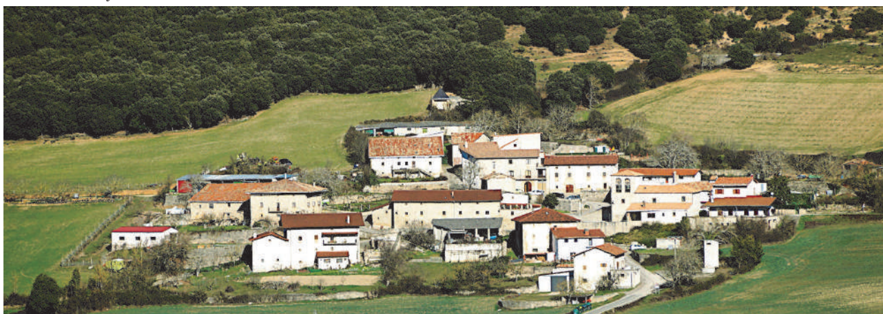
Vista del concejo de Atondo.

chos de ellos perfumados de épica: como las expediciones de Abd-el-Rahman II (843) y Abd-el-Rahman III (924) a la Peña de Qays o "Sajrat Qais", si es acertada su identificación como Garaño o el monte Gaztelu. O durante la Conquista de Navarra, las escaramuzas de una partida de roncaleses agramonteses agazapados esperando un 22 de julio de 1512 el paso de las tropas de Alba, que finalmente rodeo por Aizcorbe. O en el más reciente de la Guerra contra la Convención, que desencadenó en el entorno varias operaciones, como en el collado de Ollaregui (entre el Churregui y el Gaztelu), donde nos cuenta Luis Eduardo Oslé Guerenián como el 4º Batallón de Paisanos de Navarra junto con los dos batallones del Regimiento África (el que guarnecía Pamplona y el que guarnecía San Sebastián), otro 22 de julio, por cierto, -pero esta vez de 1795- «resistieron, llegando a combatir cuerpo a cuerpo, y pudieron mantener la posición. Este regimiento de infantería perteneciente al "Tercio Viejo de Sicilia" n.º 67, ganó el sobrenombre de "El Valeroso" y su lema "Valor, Firmeza y Constancia" en la defensa de Pamplona, episodio, por cierto, muy poco (re) conocido. Queda triste constancia en otras poblaciones navarras de la desolación en que se sumieron tras el paso de la Francesada. Quizá la noticia de ello pudo espolear el ánimo de los vecinos de las Cendeas de Iza, Olza y Olo.