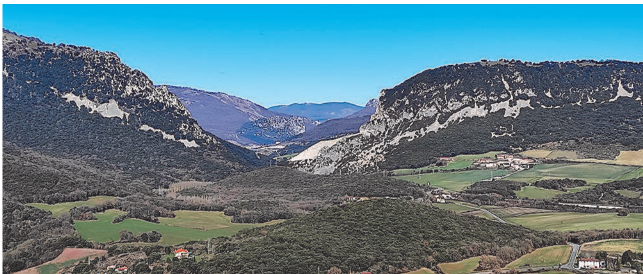
El Desfiladero de Osquía visto desde Garaño. A la izquierda se muestra el monte Gaztelu y a la derecha el monte Vizcay (Osquía). Atondo se muestra a los pies del Vizcay. Al fondo, Irurzun y las Dos Hermanas.

En la actualidad el paso de la civilización ha domesticado el paisaje buscando simplificar y acortar las mejores rutas de comunicación. Han sido especialmente los últimos 150 años los testigos de un cambio drástico que han llevado a devaluar la relevancia de lugares y caminos antaño poderosos. Entonces los pasos naturales prevalecían. Ahora viaductos, túneles y desbrozamientos de terreno promueven pasos artificiales. Es interesante viajar por aquellos parajes con tal solera buscando las huellas que ayudan a entender la relevancia de lugares como Osquía (Atondo).