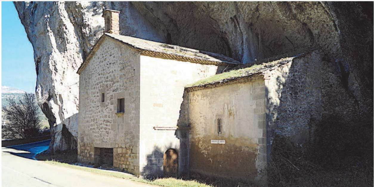
Vista exterior del santuario de la Virgen del Pilar de Osquía

A mitades del siglo XIX la comunicación por ferrocarril se había establecido entre Alsasua y Zaragoza. Por esas fechas, en 1865, se construye la carretera de Astráin (Olza) a Iruzun.