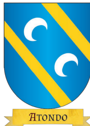
Armas de Atondo.

Himno a la Virgen de Osquía, cantado en la romería