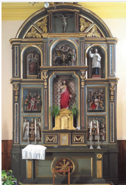
Retablo mayor (arriba) y talla de la Virgen de Osquía (debajo) preservados en la parroquia de San Martín de Atondo.

También, iniciada la procesión conjuntamente, se realiza otra parada en el paraje conocido como "La Playa" para realizar la bendición de los campos.