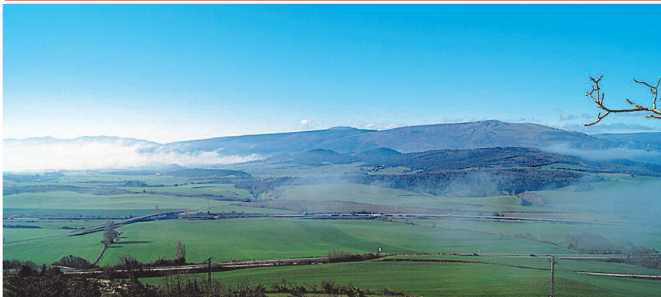
Vista parcial, entre brumas, de la Cendea de Iza (Ayuntamiento de Iza).