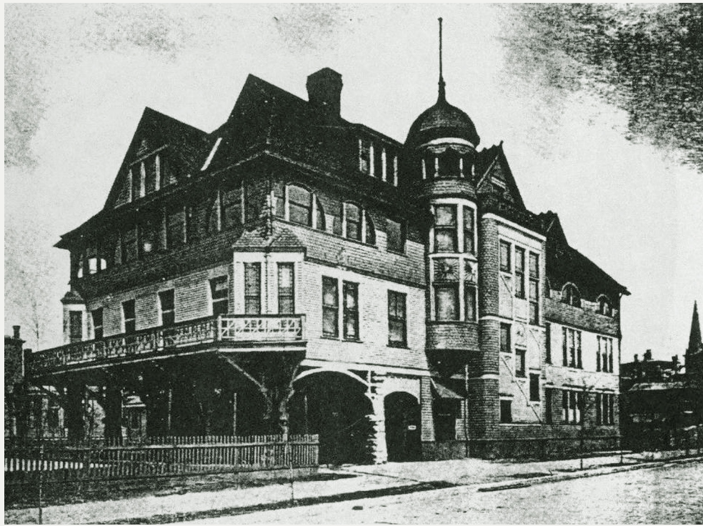
Figura 2. Escuela Flexner, c. 1906.

Los graduados de la Escuela Flexner fueron aceptados para liderar colegios, y comenzaron a llamar la atención; incluso, de Eliot, presidente de la Universidad de Harvard, quien le escribió a Flexner, curioso por el método educativo que utilizaba. Cuando