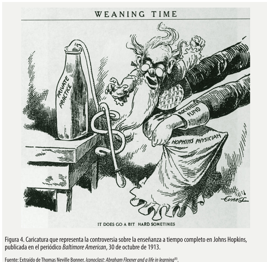
Figura 4. Caricatura que representa la controversia sobre la enseñanza a tiempo completo en Johns Hopkins, publicada en el periódico Baltimore American , 30 de octubre de 1913.

Muchas de las recomendaciones del Informe se cumplieron en poco tiempo, en parte debido a que, en general, médicos, población y autoridades coincidían en la propuesta y sus beneficios, lo cual facilitó su cumplimiento (35,42) . La publicación del Informe problematizó la falta de regulación de las especialidades médicas, y permitió que la AMA, en 1913, pasara a regularlas (6) . Así, las ideas corporativas de la AMA comenzaron a estructurar las bases del imperio médico que