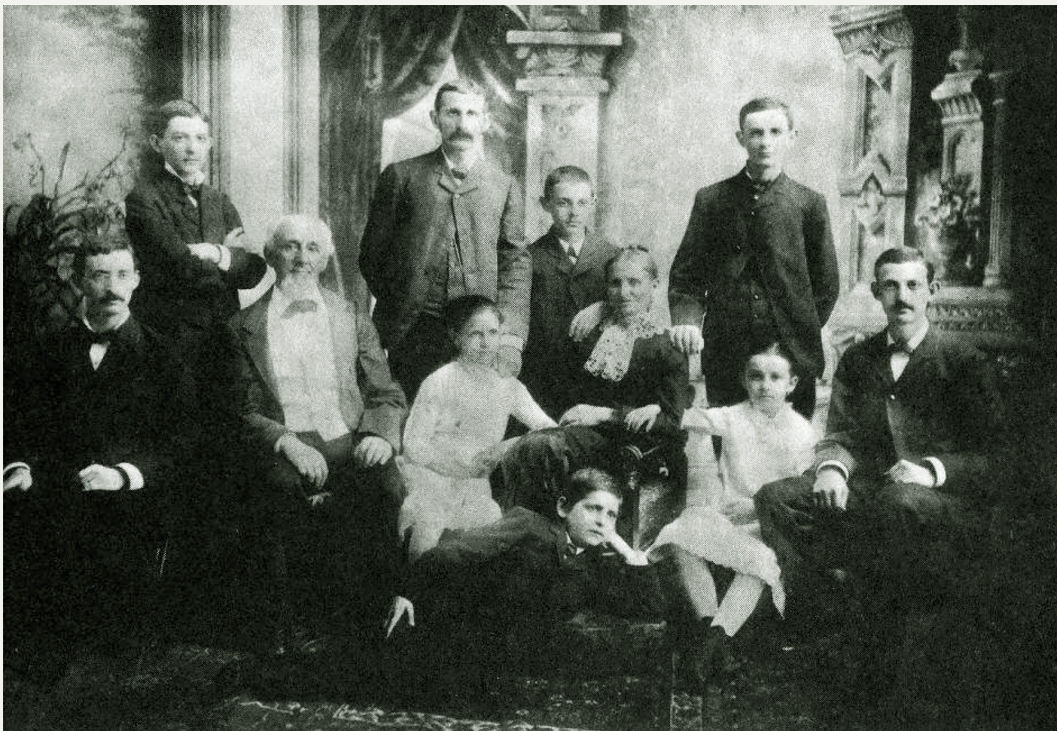
Figura 1. La familia Flexner a principios de la década de 1880. Abraham es el segundo de la derecha en la última fila.

gracias a su hermano mayor, Jacob, quien financió sus estudios en la Universidad Johns Hopkins (8,35) . Allí, en 1886, Abraham completó un Bachelor of Arts , y luego de graduarse con un título en Classics , regresó a Louisville, para trabajar como docente en una escuela, dando clases de griego y latín (8) . Así comenzó a tener estudiantes particulares. Tiempo más tarde, aburrido del trabajo en la escuela, apostó a vivir del ingreso económico que obtenía de las clases. Esta experiencia le permitió ver que los grupos pequeños, que aprendían de manera personalizada, teniendo en cuenta sus intereses, lograban rendimientos superiores a los que se obtenían en otros colegios. El éxito de su método hizo que acudieran a sus clases jóvenes con problemas de atención, que luego conseguían entrar a la universidad, incluso a edades menores que los formados en escuelas de elite (8) .