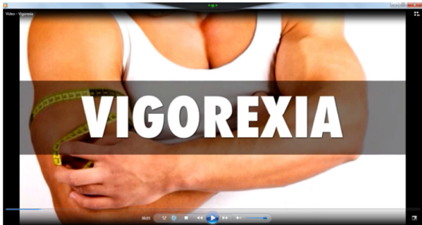
Figura 3. Vídeo sobre vigorexia. Fonte: Associação Brasileira de Psiquiatria (2015).

adolescentes na disciplina de Educação Física (do Campus Arraial do Cabo do Instituto Federal de Educação, Ciência e Tecnologia do Rio de Janeiro) mostrou-se extremamente complicada, já que ainda são incipientes os materiais com validade de conteúdo e com linguagem adaptada à etapa do Ensino Médio. Um vídeo com linguagem simples e de fácil entendimento foi encontrado e aproveitado (Figura 3).