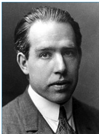
Figura 1. Niels Bohr (1885-1962) ( https://bit.ly/1j5gHly , visitada el 12/03/2019). Científico danés que realizó contribuciones fundamentales para la comprensión de la estructura del átomo y la mecánica cuántica. Fue galardonado con el premio Nobel de Física en 1922

El bohrio es radiactivo, no tiene isótopos estables o naturales, y su isótopo conocido más estable, 270 Bh, tiene una vida media de aproximadamente 61 s, aunque el isótopo 278 Bh podría tener, aún sin confirmar, una vida media de unos 690 s. [3]