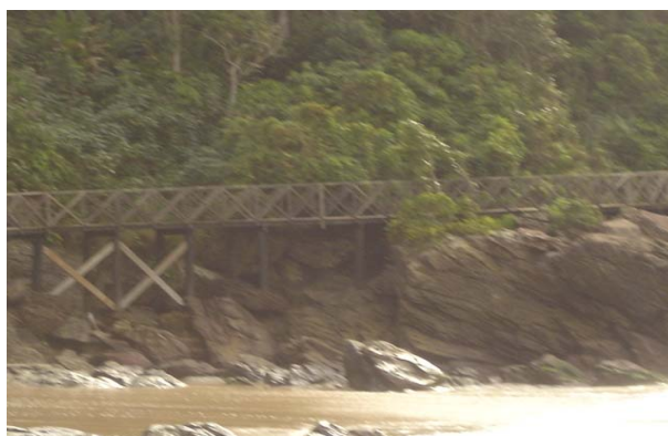
Foto 7: Percurso por deck sentido praia do buraco/costão praia dos amores