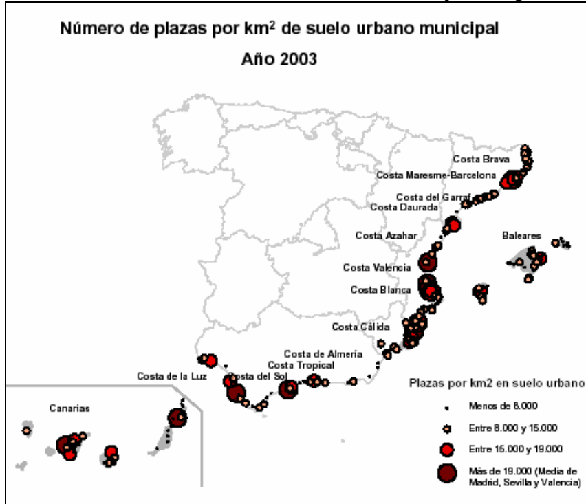
Gráfico 1. Saturación en la línea de costa este y sur española.