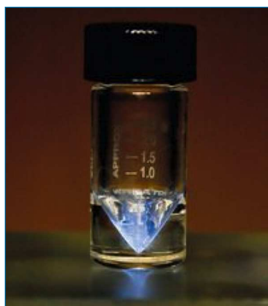
Figura 1. Disolución acuosa de una sal del catión trivalente de 225 Ac mostrando luminiscencia de Cherenkov [2]

En la naturaleza se encuentran diferentes isótopos del actinio contenidos en minerales de uranio y torio, especialmente el más estable, 227 Ac, un miembro transitorio de la serie de decaimiento radioactivo del uranio, con un tiempo de vida medio relativamente largo (21,8 años). El resto de isótopos del actinio son mucho más inestables, no existiendo una composición isotópica característica que permita asignar un peso atómico estándar para este elemento. El 225 Ac es el siguiente isótopo menos inestable, siendo un radionúclido resultante del decaimiento del neptunio, que pese a su corto tiempo de vida (tan solo 10 días), se encuentra presente en la naturaleza gracias a la producción continuada de 237 Np a partir de 238 U, el isótopo natural más abundante del uranio. El isótopo natural 228 Ac (6,1 horas), también conocido