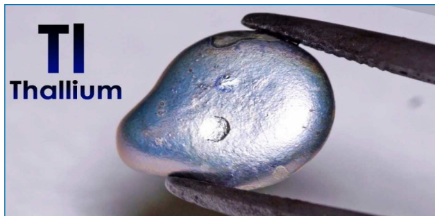
Figura 1. Imagen de talio, donde se observa que posee un aspecto físico muy parecido al plomo [https://bit.ly/2SFvydX, visitada el 05/03/2019]

Si bien todos los elementos del Grupo 13 de la Tabla Periódica poseen una serie de similitudes debido a que presentan el mismo número de electrones de valencia ( ns 2 np 1 ), lo que hace, por ejemplo, que todos compartan el estado de oxidación +3, una gran diversidad de propiedades es lo que llama la atención de esta familia de elementos químicos. [2] Por ejemplo, a diferencia del resto de componentes de este grupo, el estado de oxidación +1 es predominante en el talio; el Tl(III) posee un gran poder oxidante.