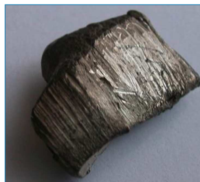
Figura 1. Iterbio metálico [2]

El iterbio puede llegar al medio ambiente por los vertidos de industrias petroquímicas o por electrodomésticos en desuso. Se puede acumular gradualmente en los suelos y contaminar sus aguas, lo que puede incrementar su concentración en los seres humanos y otros animales, hasta provocar daños en las membranas celulares y afectar al sistema nervioso central. [4]