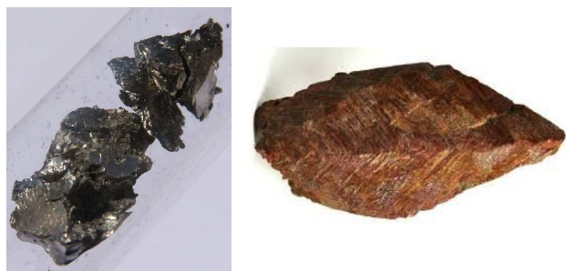
Figura 1. Lámina de Pr metálico y mineral monacita ( https:// bit.ly/20iZWt0 , visitada el 25/03/2019)