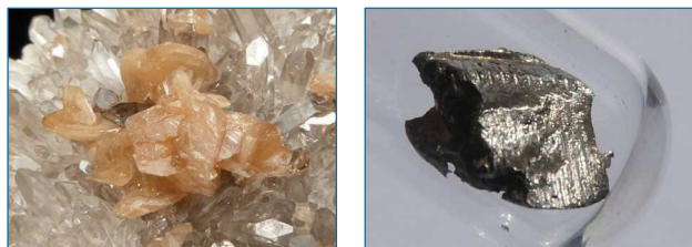
Figura 1. Izda.: Cristales de color rosa anaranjado de monacita-(Ce) y cuarzo de Bolivia de aproximadamente 5 mm de longitud ( https://bit.ly/2BSrAJF , visitada el 25/03/2019). Dcha.: Cristal de cerio metálico ( https://bit.ly/20mciBw , visitada el 25/03/2019)

Una de las aplicaciones del elemento 58 que más repercute en nuestra vida cotidiana es su uso como catalizador en la industria petroquímica. Zeolitas dopadas con óxidos de cerio y lantano son utilizadas en el craqueo del petróleo y, combinado con metales preciosos como el platino, transforma los gases contaminantes procedentes de la combustión de los combustibles fósiles en N 2 , CO 2 y H 2 O. Estas aplicaciones se deben a la interconversión Ce(III)/Ce(IV), única entre el resto de los lantánidos. Pero lo que realmente hace interesantes