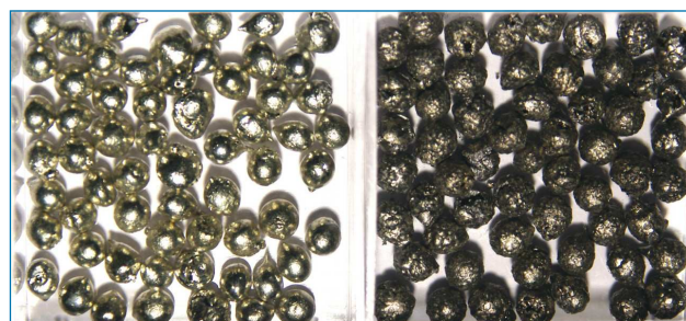
Figura 1. Estaño de alta pureza (99,999 %) en sus formas alotrópicas β (estaño blanco, izq.) y α (estaño gris, der.) [3]

El estaño, debido a su bajo punto de fusión, es ampliamente utilizado en la soldadura de circuitos electrónicos y fontanería. Un último ejemplo, algo más trivial es en la producción de láminas planas de vidrio que se obtienen colocando el vidrio fundido sobre una superficie de estaño fundido en un recipiente grande y poco profundo para su enfriamiento.