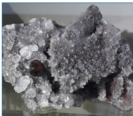
Figura 1. Esfalerita (con calcita y cuarzo). Procedencia: Mina Yaogangxian, China [6]

El zinc es un metal sólido bastante frágil a temperatura ambiente, de color gris azulado. Entre 100 - 150 °C es un metal blando y dúctil fácilmente maleable que puede ser transformado en cables o enrollado como finas láminas. A temperaturas superiores a 200 °C adquiere de nuevo un carácter quebradizo y puede pulverizarse con facilidad.