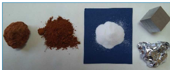
Figura 1. De izquierda a derecha: Bauxita original y molida, alúmina (blanca), y Al (cubo de 2,5 cm de lado y muestra de “papel” de aluminio). Fotografía tomada por G. Pinto de muestras donadas por el Grupo Alcoa España en 2010 a la E.T.S. Ingenieros Industriales (Universidad Politécnica de Madrid)

con magnesio, se denomina “mezcla termita” y se usa, por ejemplo, para soldar carriles ferroviarios.