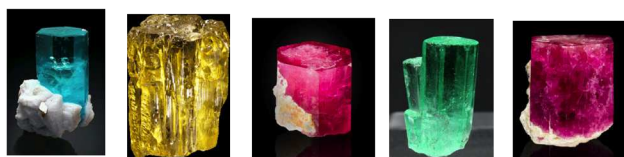
Figura 1. Diferentes minerales berilo, de izquierda a derecha: aguamarina, heliodoro, morganita, esmeralda y bixbita

El mineral berilo, que es un ciclosilicato de berilio y aluminio ( \text{Be}_3\text{Al}_2(\text{SiO}_3)_6 ), se conoce desde la antigüedad en diversas formas. Esta sal es incolora, pero diferentes impurezas confieren al berilo colores diversos que caracterizan una serie de piedras semipreciosas o preciosas (Figura 1), como el aguamarina (azul, debido a impurezas de \text{Fe}^{2+} ), el heliodoro (el berilo más abundante cuyo nombre alude a su color amarillo miel debido a impurezas de \text{Fe}^{3+} ), la morganita o berilo rosa (cuyo color viene causado por impurezas de \text{Mn}^{2+} ), la esmeralda (verde, color producido por impurezas de Cr y a veces V) o la bixbita o esmeralda roja (cuyo color se debe a impurezas de \text{Mn}^{3+} ).