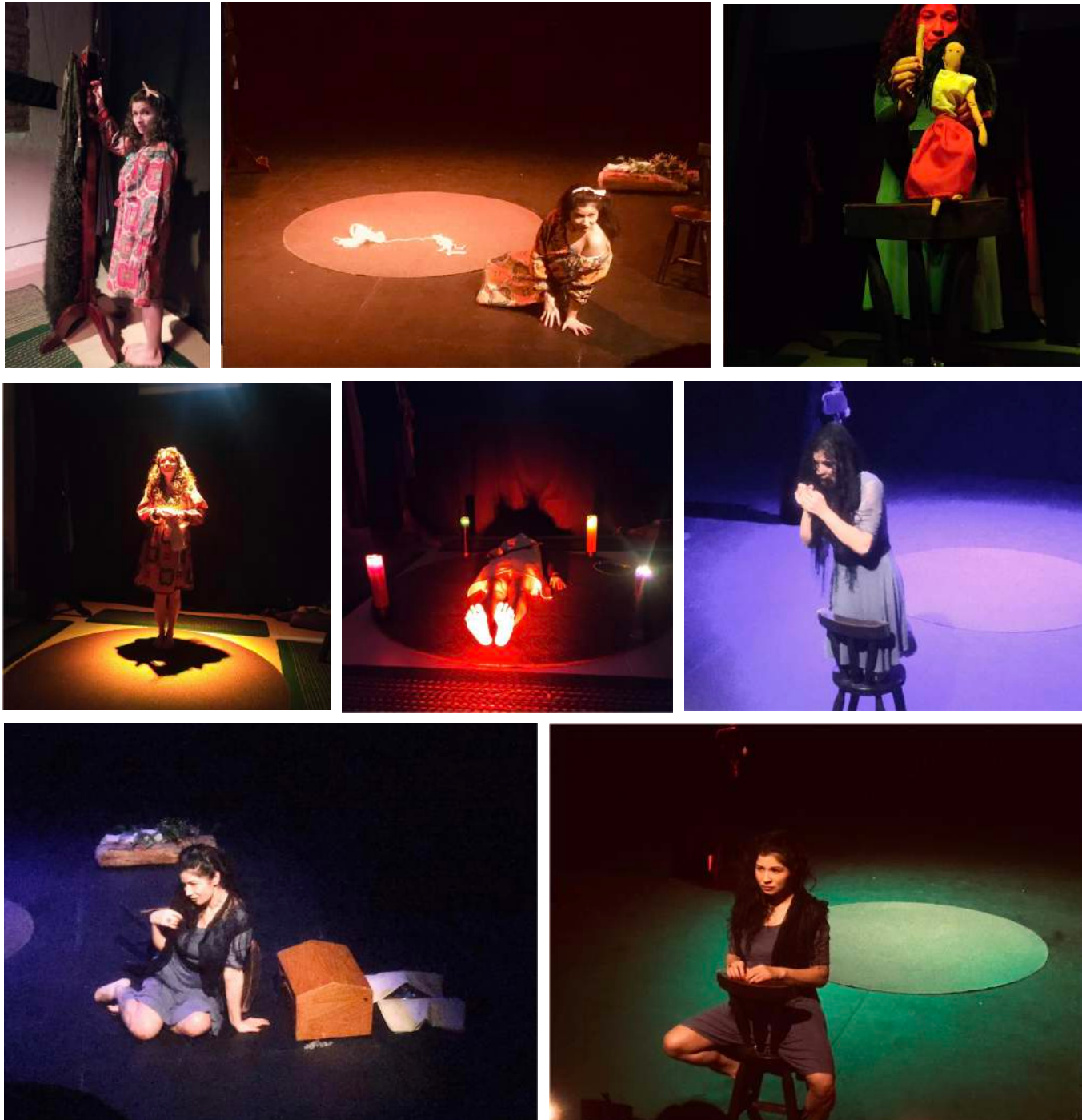
Imagen 6. Registro presencial de Cortejos de bruja .