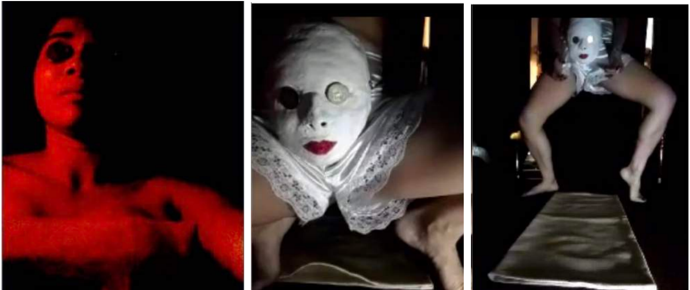
Imagen 4. Registro virtual de Cortejos de bruja . Fotografías del Teatro Vargastejada, Casa de Fu.

Ya la dramaturgia, lo escrito, hace memoria desde el corazón el relato fuente de la obra, cuando el autor busca en su vivencia personal paralelos a partir de los cuales dibujar al personaje, perfilado más objetivamente en la fuente histórica. Pero el actor potencia este procedimiento, que resulta metáfora viva, para apropiarse al personaje y darle un cuerpo, un rostro, una voz que hable desde la memoria de la verdad, estableciendo analogías a partir de su experiencia personal, las cuales van constituyendo lo que ve el espectador.