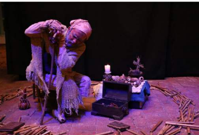
Imagen 5. Registro presencial de Curandero .