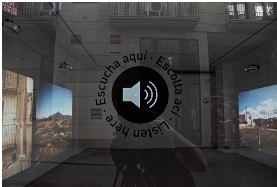
Figura 6. Detalle de la señal en el cristal de la galería que indica la ubicación del altavoz de contacto e invita al espectador a acercarse para escuchar la pista sonora de la videoinstalación

expositivo de obras de arte sonoro y en otras formas de exhibición del sonido. El recurso técnico utilizado fue el empleo de un altavoz de contacto, un dispositivo sonoro que carece de membrana con que emitir las vibraciones. En su lugar las vibraciones son transmitidas desde una superficie metálica completada con una ventosa que se adhiere a cualquier superficie plana presente en el mobiliario -una tabla, un cristal- y utiliza esta misma superficie como elemento vibratorio generador del sonido. De esta manera el propio cristal de la galería escaparate se convertía en un gran altavoz encargado de transmitir las vibraciones de la pista sonora, tanto en el interior como en el exterior de la sala. Precisamente en el exterior, al tratarse de un cristal blindado, la vibración era muy inferior, con lo que también lo era el volumen de reproducción. Eso permitía que el sonido no interfiriera en el ambiente acústico de la calle y que, además, los espectadores-viandantes tuvieran que acercarse físicamente al cristal, casi pegando la oreja a él, para descubrir que la vibración de ese escaparate emitía sonidos, concretamente la voz de un artista recitando un poema. Un adhesivo de vinilo instalado en el centro del cristal indicaba sus propiedades sonoras e invitaba al espectador a acercarse para escuchar, generando esa interacción física con la obra y con la propia arquitectura de la galería.