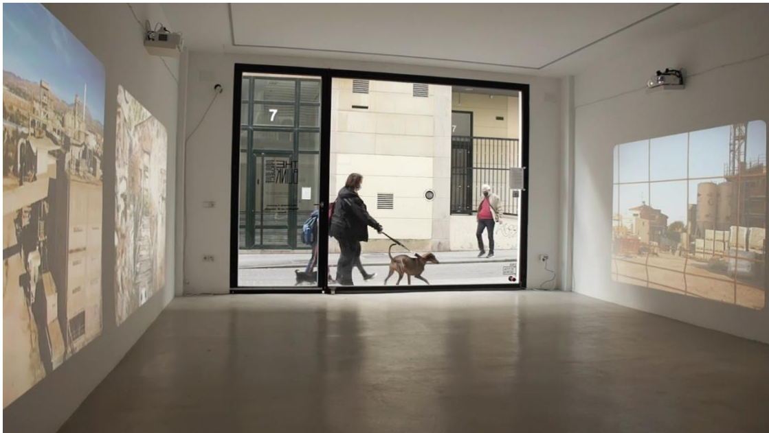
Figura 8. Otra vista interior de Una Petita Pàtria en la que se observa su convivencia con el tránsito cotidiano. Fotograma del teaser video disponible en https://youtu.be/1pgAo_zrFWg

El transitar con cámara nunca ha sido tan fácil, y el tránsito es en sí mismo una forma de narrar que permite nuevos relatos –fijémonos si no en la popularidad de los youtubers que interactúan con sus espectadores dirigiéndose a la cámara del móvil andan hablan por la calle–. También las tecnologías de postproducción permiten producciones cada vez más sofisticadas con cada vez menos medios y equipos de personal, lo que permite al artista cineasta complejas propuestas estéticas desde sencillos procesos.