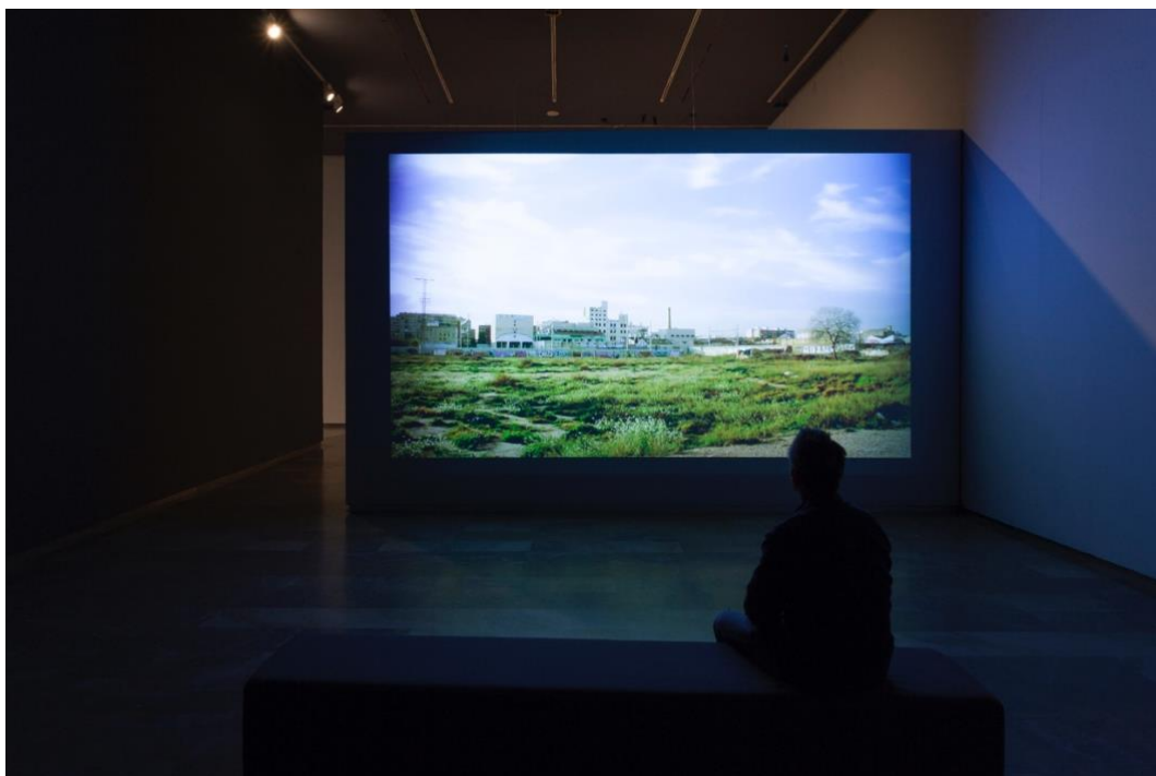
Figura 1. La pieza Aquestes coses que fem avui en dia expuesta en el Centre del Carme Cultura Contemporània CCCC (València). Foto de Juan Peiró (2018).

Estos rasgos estéticos y conceptuales definirían la base del proceso de creación que se perpetuaría en los años sucesivos y que aquí planteamos. Sin embargo, más allá del resultado estético, como autor conviene aportar algunas cuestiones sobre el proceso de creación que definitivamente lo alejaban de la metodología de una producción cinematográfica convencional.