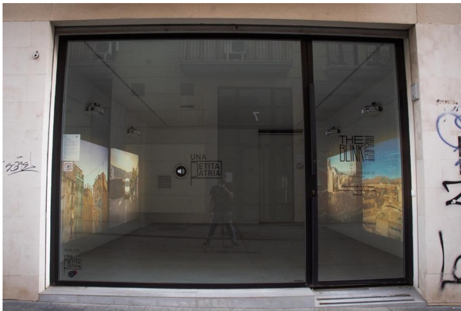
Figuras 4 y 5. La instalación Una Petita Pàtria vista desde el interior de la galería The Blink Project y desde el exterior de la calle Carrasquer (Valencia).

Efectivamente, el reto más importante era resolver la cuestión sonora, pero recordemos que a esa cuestión nos habíamos enfrentado ya en la anterior etapa, asumiendo el principio cinematográfico original de asumir la no-sincronía, el transitar paralelo entre las imágenes mudas montadas de forma aleatoria y la pista sonora lineal. El inconveniente principal consistía en hacer que esta pista sonora fuera escuchada desde la calle sin que existiera contaminación acústica.