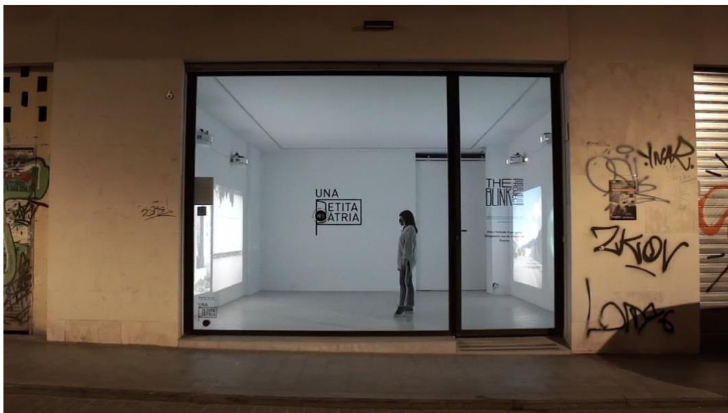
Figura 7. Vista nocturna de la instalación desde la calle Carrasquer. Fotograma del teaser video disponible en https://youtu.be/1pgAo_zrFWg

Con un registro estético tan cercano al paisajismo romántico como al documental realista, el artista ofrece al espectador una mirada a veces furtiva hacia una realidad en la que pocas veces los seres humanos son protagonistas, pero en la que su huella está siempre presente. Los espacios de las clases populares, sus lugares de trabajo y de ocio, los rincones olvidados de las ciudades asumen el protagonismo de esta pieza envolvente. Esta mirada no es nueva para el artista, sino que se enmarca en un universo que ha andado varias veces en los últimos años (Garsán, 2020).