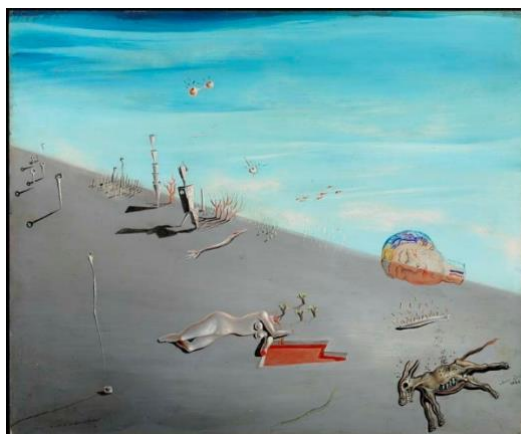
Figura 1. Salvador Dalí (1926). La miel es más dulce que la sangre . Óleo sobre madera, 36x44 cm. Colección privada.

resulta destrozado, mutilado y nunca completo (fig. 1), salvo que venga acompañado de una figura masculina o representado según el arquetipo ideal. La mujer real y concreta no es digna, sino que debe ser perfecta, imaginada y diosa. Un prototipo ficticio que, sin duda, se ha globalizado gracias a la reproducción mecánica de las imágenes. Cualquier visión al margen es sospechosa y maligna, rápidamente vinculada al término de femme fatale .