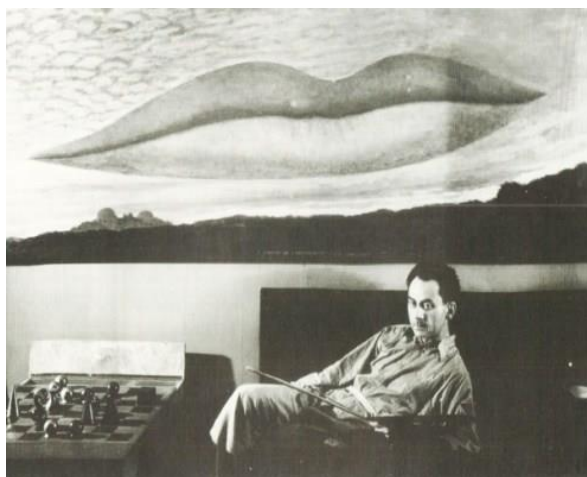
Figura 4. Man Ray (1935). Man Ray devant son tableau "À l'heure de l'observatoire – Les Amoureux" (1932-1934). De la serie Les amoureux. Fotografía.

Desde entonces, los labios que dan título a la serie (quizás, los de Lee) se reiteran en las composiciones sucesivas. Concretamente, en una de ellas (figura 5), encontramos una escultura de tono griego mutilada, arquetipo surrealista ya comentado, así como su bipolar comportamiento de negar y utilizar influencias del arte anterior. En esta ocasión, la imagen ofrece multitud de lecturas, nuevamente degradantes hacia la mujer. En primer lugar, las piezas de ajedrez no están dispersas por el tablero, sino colocadas en sus posiciones iniciales, ya sea porque la partida ha finalizado o ni siquiera ha dado comienzo. En segundo lugar, la figura femenina es ahora inmóvil, ¿por su frialdad con el fotógrafo o su incapacidad de jugar a un juego diseñado por él? En tercer y último lugar, la sensación de control se representa más sutilmente que el caso anterior, sin un dueño física o directamente representado. Todo remite al surrealismo, así como todas las piezas de la toma aluden un único creador, Man Ray.