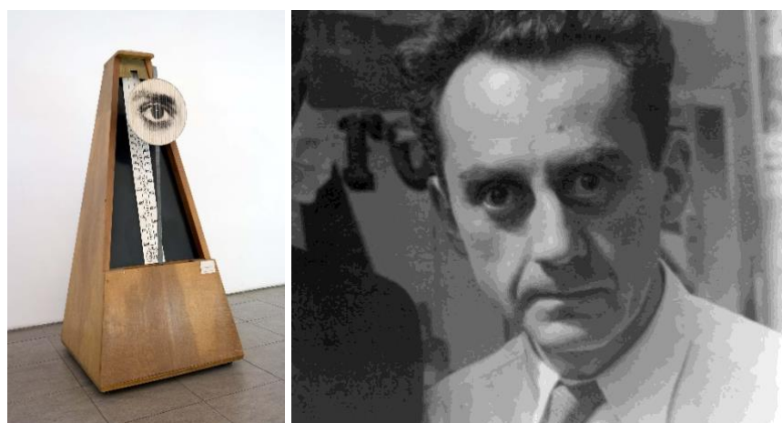
Figuras 8 y 9. A la izquierda: Man Ray. Objet indestructible . (c.1933/1982). MNCARS. A la derecha: Retrato de Man Ray . (c.1934).

Lo que resulta interesante es la comparación de esta pieza con Objet indestructible [Objeto indestructible] (fig. 8), hoy en día perteneciente a la colección del Museo Nacional Centro de Arte Reina Sofía. La primera diferencia es el tamaño, presentando unas medidas evidentemente mayores. La segunda, el título, pues ahora hablamos de un objeto invencible. La tercera es la fotografía recortada, un ojo diferente, sujeto al metrónomo de forma más resistente (en comparación al clip anterior) y que, además de balancearse, parpadea.