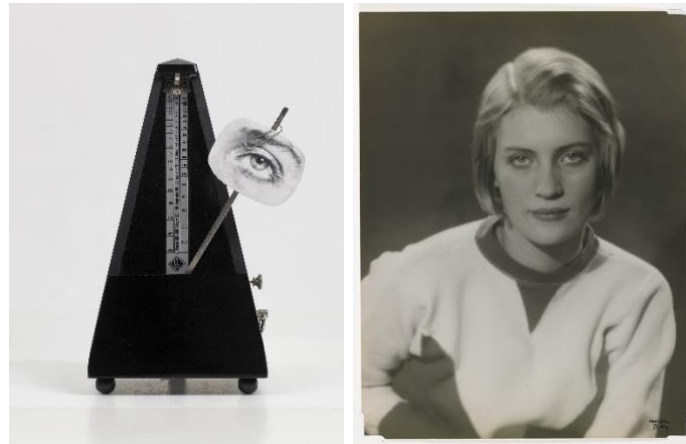
Figuras 6 y 7. A la izquierda: Man Ray. Objet de destruction . (c.1933). A la derecha: Man Ray. Retrato de Lee Miller . (1932). © Man Ray / ADAGP. Impresión en gelatina de plata.

En Objet de destruction [Objeto de destrucción] la punta del metrónomo entrona el recorte fotográfico de un ojo que nos resulta familiar, más aún al compararlo con la cantidad de retratos realizados a la joven Lee durante los años veinte (fig. 6 y 7).