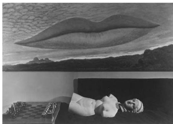
Figura 5. Man Ray (1934). Bodegón con ajedrez y escayola . De la serie Les amoureux . Fotografía. © Man Ray / ADAGP.

Desde entonces, los labios que dan título a la serie (quizás, los de Lee) se reiteran en las composiciones sucesivas. Concretamente, en una de ellas (figura 5), encontramos una escultura de tono griego mutilada, arquetipo surrealista ya comentado, así como su bipolar comportamiento de negar y utilizar influencias del arte anterior. En esta ocasión, la imagen ofrece multitud de lecturas, nuevamente degradantes hacia la mujer. En primer lugar, las piezas de ajedrez no están dispersas por el tablero, sino colocadas en sus posiciones iniciales, ya sea porque la partida ha finalizado o ni siquiera ha dado comienzo. En segundo lugar, la figura femenina es ahora inmóvil, ¿por su frialdad con el fotógrafo o su incapacidad de jugar a un juego diseñado por él? En tercer y último lugar, la sensación de control se representa más sutilmente que el caso anterior, sin un dueño física o directamente representado. Todo remite al surrealismo, así como todas las piezas de la toma aluden un único creador, Man Ray.