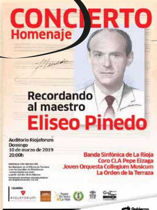
Concierto homenaje a Eliseo Pinedo celebrado en Riojaforum en 2019.

asegurarán su memoria, como la Distinción al Mérito Provincial (1978) o diferentes reconocimientos en Zarratón y Haro.