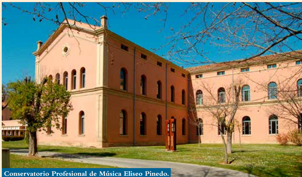
Conservatorio Profesional de Música Eliseo Pinedo.