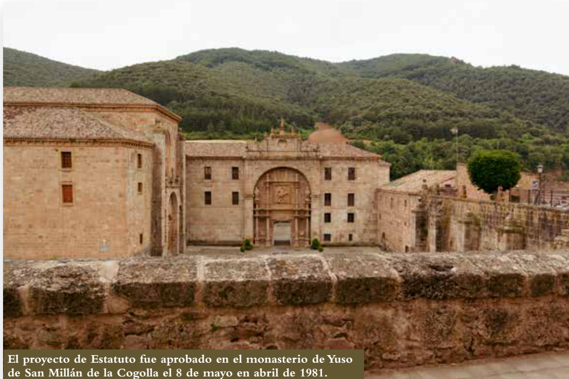
El proyecto de Estatuto fue aprobado en el monasterio de Yuso de San Millán de la Cogolla el 8 de mayo en abril de 1981.

El Estatuto de San Millán reconoce en el papel lo que en la práctica era un hecho. Los lemas “La Rioja existe” o “La Rioja empieza a caminar” no son ni de lejos una construcción inventada, pues la prueba está en la larga tradición histórica que tenía ese pueblo, de pequeña población y, sin embargo, de tan hondas raíces y sentimientos anclados en la historia más antigua de España, en la que ha tenido grandes protagonistas.