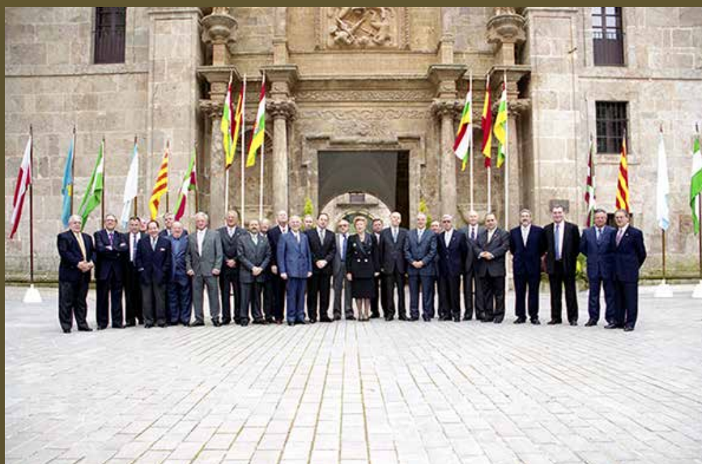
Foto de familia en el 20º aniversario de la firma del Estatuto.