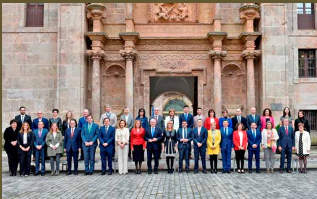
Imagen del Parlamento y el Gobierno de La Rioja tras el debate de reforma del Estatuto.