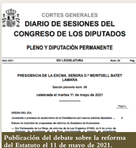
Publicación del debate sobre la reforma del Estatuto el 11 de mayo de 2021.

La garantía del éxito de este texto es el deseo de todos de caminar juntos y serenos ante unas oportunidades de avances y progreso