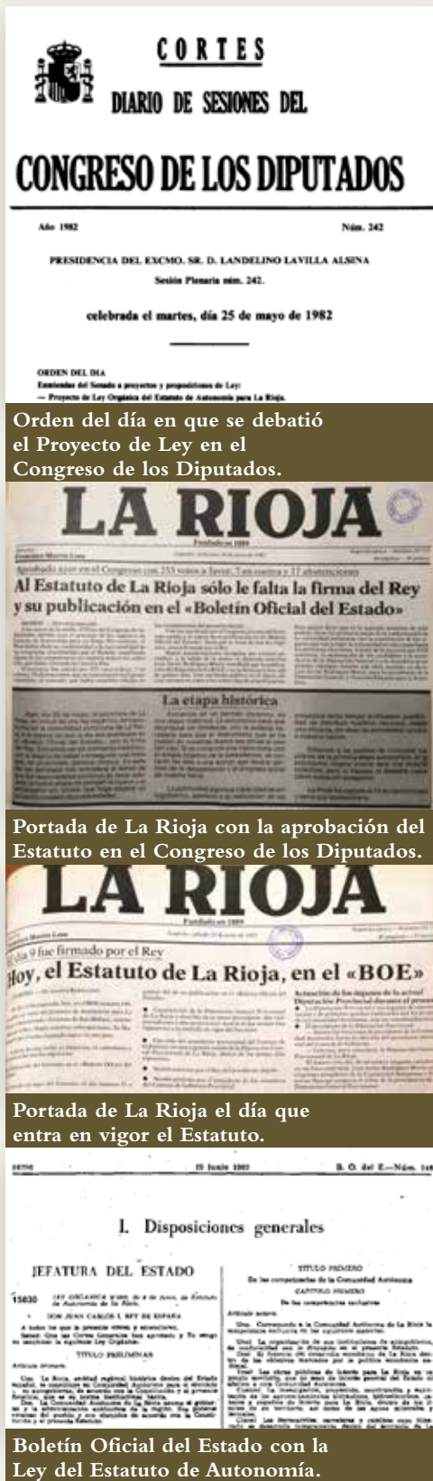
Orden del día en que se debatió el Proyecto de Ley en el Congreso de los Diputados.

Por tanto, el 25 de mayo de 1982 se cumplía uno de esos sueños por alcanzar de los riojanos: el Congreso de los Diputados votaba a favor de la aprobación del Proyecto de Ley Orgánica del Estatuto de Autonomía para La Rioja. Se reconocía así una larga tradición de siglos, tanto en el plano administrativo como político.