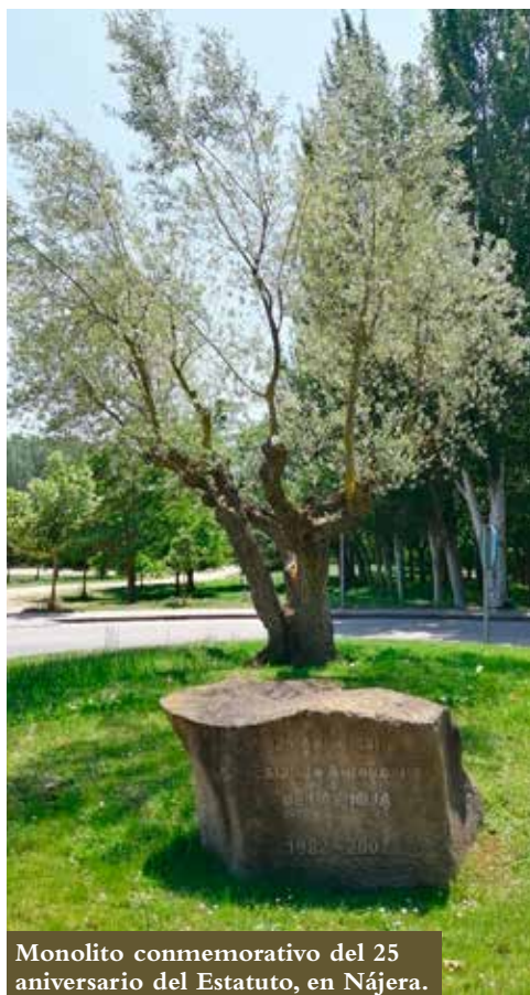
Monolito conmemorativo del 25 aniversario del Estatuto, en Nájera.

Importante es destacar la unidad política, primero, para la aprobación del texto estatutario y, después, para sus reformas. Numerosos partidos políticos han acordado y aprobado las sucesivas reformas y han participado en el período democrático, construyendo y desarrollando la Comunidad Autónoma de La Rioja: UCD, PSOE, AP-PP, CDS, IU, PRP-PR-PR+, Podemos y Ciudadanos. La garantía del éxito de este texto es, sin duda, el deseo de todos de caminar juntos