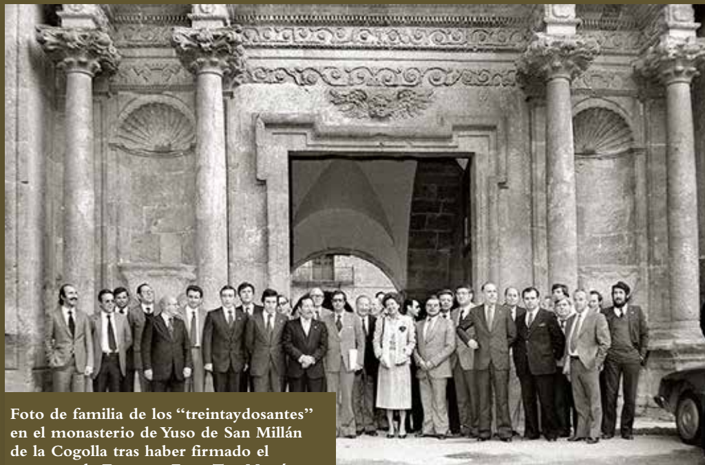
Foto de familia de los “treintaydosantes” en el monasterio de Yuso de San Millán de la Cogolla tras haber firmado el proyecto de Estatuto.

senadores de UCD, a través de una moción presentada en el Senado en octubre de 1979, consiguen que se debata el cambio de denominación de la Provincia de Logroño por el de Provincia de La Rioja. La moción tendrá el apoyo de todos los parlamentarios riojanos, cuyo esfuerzo común logrará hacer comprender la realidad riojana en la capital del reino. Finalmente, la Proposición de Ley se aprueba más de un año después, el 25 de octubre de 1980, ante las trabas puestas por el propio Gobierno de España, del partido proponente.