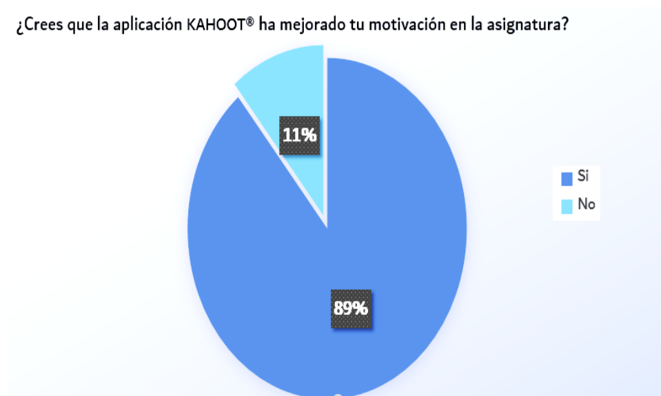
Figura 3. Valoración del efecto sobre la motivación de la plataforma Kahoot®

En la pregunta 4, se consultó si consideraban estas aplicaciones como herramientas que mejorasen la motivación del alumno, siendo valoradas de manera positiva en un 89% de los encuestados.