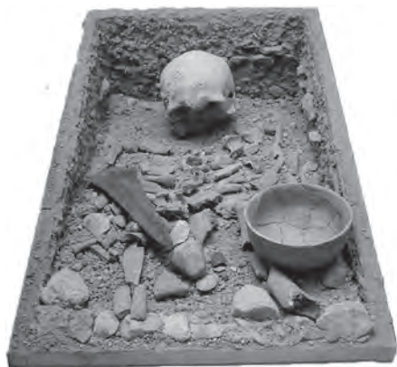
Fig. 5. Reconstrucción de tumba argárica.

1981: 106) (Fig. 5). Los restos conservados pertenecen a una inhumación en fosa de un individuo joven, masculino, acompañado por un ajuar compuesto por un cuenco cerámico hecho a mano, un útil de sílex, un fragmento de piedra pulimentada y una espada corta de bronce de 26 cm de longitud, excepcionalmente bien conservada (SÁNCHEZ ROMERO, JIMÉNEZ URBANO, 1984: 2). Gracias un análisis de Carbono 14 de dos clavos de unión con la empuñadura, se arrojó una datación en torno al 1800 a.C.