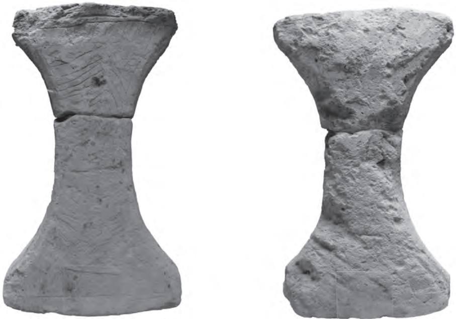
Fig. 4. Ídolos de Doña Mencía.