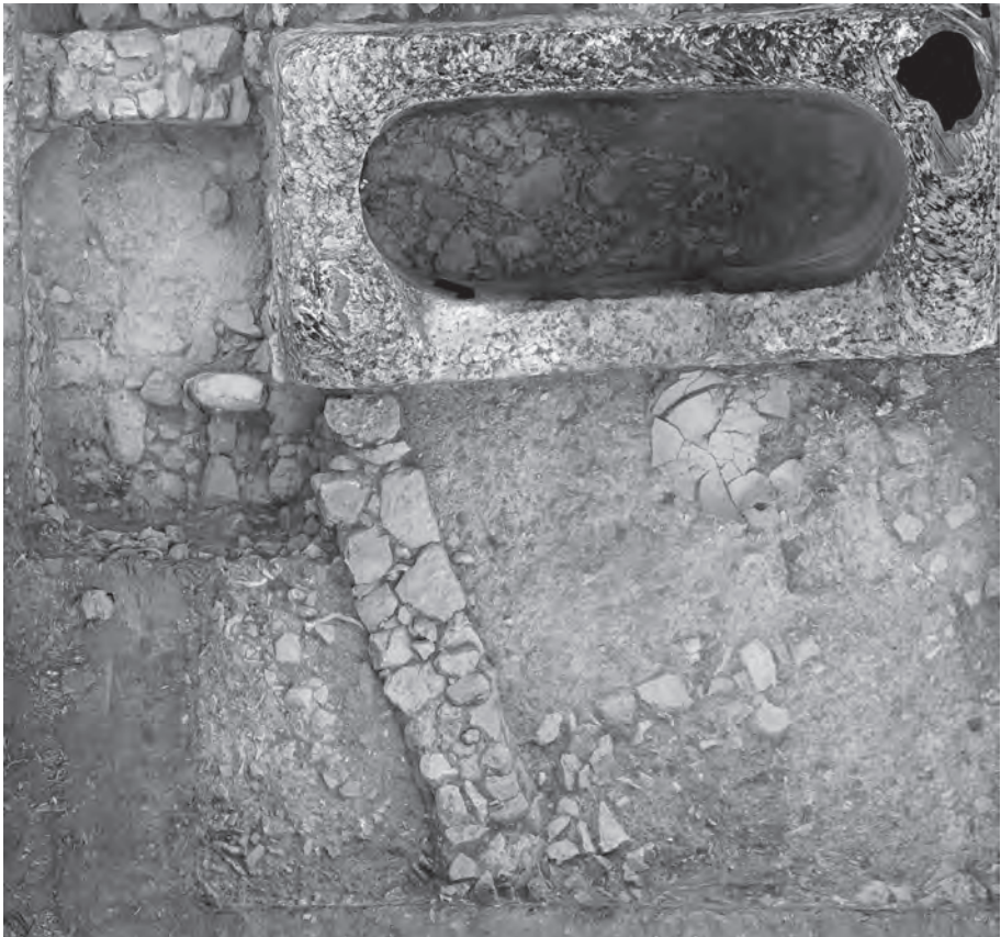
Fig. 7. Ortografía de la cisterna de El Laderón.

hecho, en la actualidad sigue manteniendo su funcionalidad original de almacenamiento de agua, pero probablemente no siempre fue así. Uno de los aspectos más interesantes, en cuanto a su uso, lo observamos en el lateral NE, donde se abrió una puerta, a un nivel mucho más elevado que el pavimento documentado, para poder acceder al interior de la misma. Dispone de una hendidura en la parte superior, a modo de dintel, y de goznes en la parte inferior, así como una hendidura en un lateral que coincidiría con el método de cierre de la puerta a través de un cerrojo (Fig. 7).