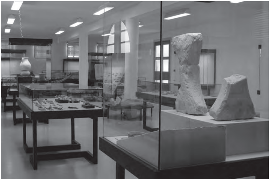
Fig. 1. Sala de exposición del Museo Histórico-Arqueológico de Doña Mencía.

Finalmente, después de los numerosos intentos llevados a cabo