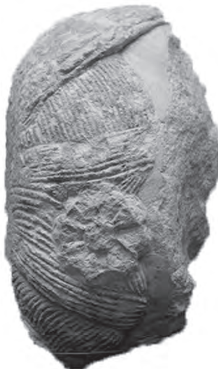
Fig. 6. Dama ibérica de Doña Mencía.

En este breve recorrido sobre los principales hallazgos documentados en El Laderón, no queremos dejar pasar por alto las evidencias arqueológicas del período ibero-romano. Entre las piezas conservadas en el Museo de Doña Mencía encontramos la que ha sido denominada como “Dama ibérica de Doña Mencía” (Fig. 6) (SÁNCHEZ ROMERO, 1980: 10; JIMÉNEZ URBANO, SÁNCHEZ ROMERO, 1984: 10). Se trata de un pequeño fragmento de piedra caliza, de aproximadamente 20 cm