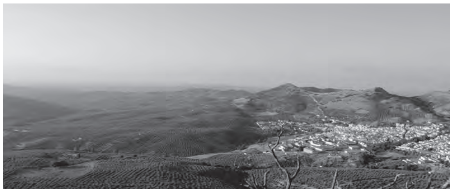
Fig. 3. Visibilidad desde el yacimiento de El Laderón con vistas a la campiña cordobesa y a Doña Mencía.