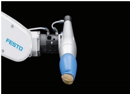
Fig. 3 Brazo Robot con mordaza de succión

Tecnología Automatizada para la Industria que maneja Festo.