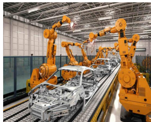
Figura 1 Fuente The Economist Intelligence Unit Figura 2 Robots industriales Fuente: Festo

Uno de los programas de estudio de Ingeniería que más aceptación tiene en México, es la Ingeniería Industrial desde su registro en 1960, y de acuerdo al reporte de Alianza Fidem A.C. en 2018, se matricularon 230,220 estudiantes, siendo el programa académico de Ingenierías con mayor población estudiantil y con mayor crecimiento que se imparten en el país, de acuerdo con la Asociación Nacional de Facultades y Escuelas de Ingeniería (ANFEI 2019), lo que representa para las Instituciones de Educación Superior (IES) un reto en cuanto a la actualización y la pertinencia de los planes de estudio (CACEI 2018), por ello se considera que asignaturas como automatización, robótica y materias relacionadas, debieran tener mayor presencia en el mapa curricular del plan de estudios de ésta carrera.