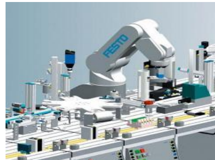
Fig. 4 Brazo Robot para manipulación de piezas

De acuerdo al sondeo realizado para conocer el nivel de satisfacción de los estudiantes respecto a los aprendizajes obtenidos, manifiestan que hoy conocen conceptos con aplicación práctica que no habían sido abordados en el transcurso de su carrera como: Histéresis, Programación de PLC , Aplicación proactiva de VSM, Programación para Sistemas Hidráulicos, Aplicaciones prácticas Electro Hidráulicas y Electroneumáticas, el concepto de Machine Vision , Proyectos prácticos y sustentables reales de Energías Renovables, Grafset , Detección de Cargas, Procesamiento de Señales, Actualidad y futuro de las Tecnologías de la Industria 4.0.