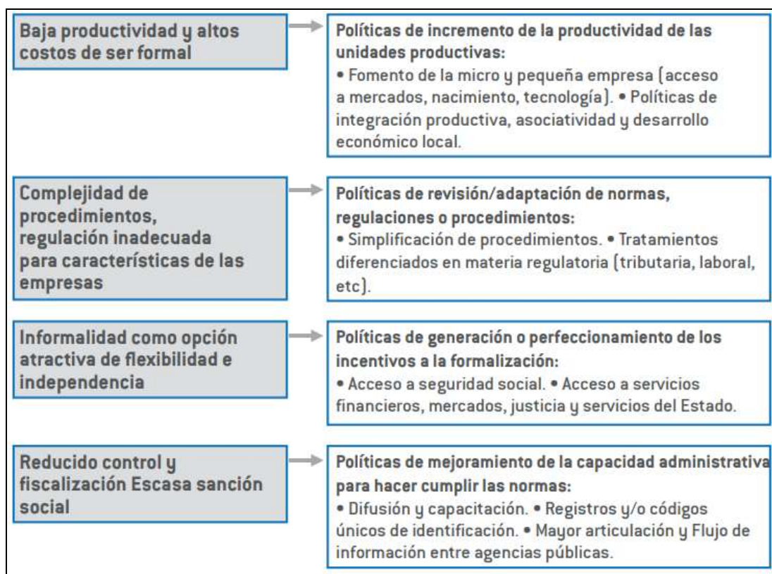
Ilustración 1, Causas de la informalidad y líneas estratégicas a tener en cuenta para mejorar la formalización

Para poder incidir en la evolución, transformación y mejorar la organización productiva, es necesaria la intervención del estado combinado con políticas de desarrollo, enfocadas en reposicionar actividades de productividad y de conocimiento, aplicando políticas laborales y formativas que mejoren la calidad de empleo, respeto a los derechos de los empleados, ya que el ámbito productivo y laboral deben estar coordinadas. (FORLAC, 2014)