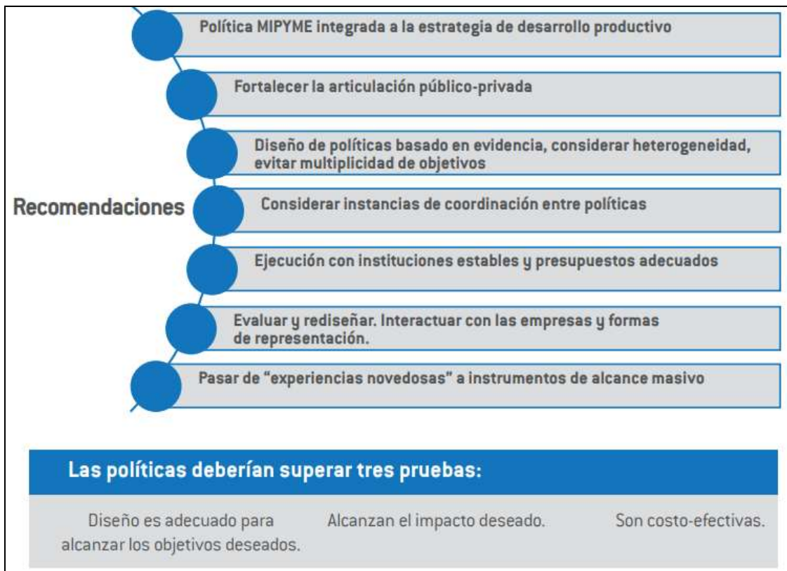
Ilustración 2, Lecciones para el diseño y ejecución de la política MIPYME

En la segunda y tercera parte, hace una descripción al detalle de como una política de desarrollo de la producción, alineado con el mercado laboral, es la herramienta principal para generar una mejora en la productividad, reducir los niveles de informalidad de las micro, pequeñas y medianas empresas.