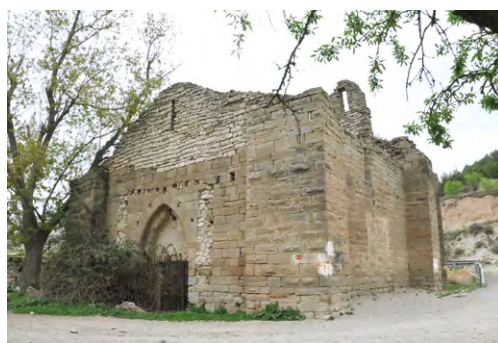
Santa Magdalena: Església del s. XIV, que formà part d'un conjunt assistencial dedicat a la cura i atenció de malalts de lepra. Emplaçat prou lluny de la vila, serví també com a llatzeret per a empestats, al peu del camí de Sant Jaume.