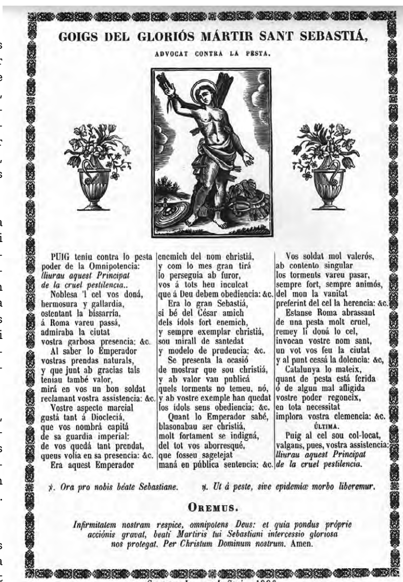
Goigs de Sant Sebastià: Durant l'Edat mitjana i moderna Sant Sebastià màrtir va ser invocat com a advocat i protector contra la pesta, la qual cosa va fer que fos proclamat patró de moltes viles i ciutats que així ho havien promès en ocasió d'alguna epidèmia. Col·lecció particular [ed. 1886].