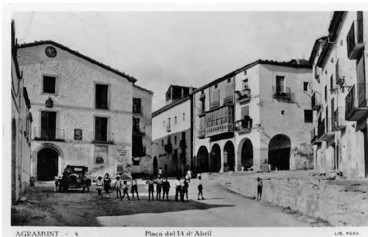
AGRAMUNT - 4