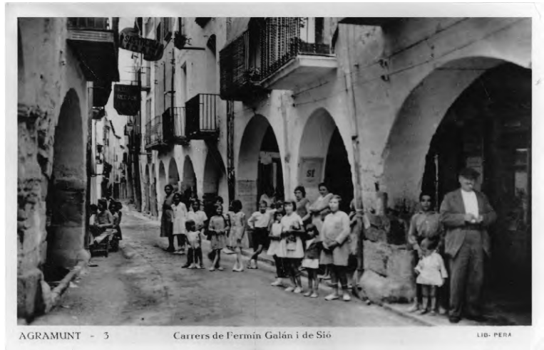
Carrers de Fermín Galán i de Sió Postal 3. Lib. Pera.

cal. Ambdós reculls s'inspiren en temps de postguerra, cal indicar que la darrera obra se circumscriu als anys seixanta. Els protagonistes de les narracions ja no són infants, sinó adults dissortats. Viladot se serveix de recursos com la ironia i l'absurditat per descriure les peripècies i fatalitats dels protagonistes, possiblement aquests recursos són un mecanisme per ressaltar encara més les tragèdies dels personatges. Així mateix, ho indica Josep Vallverdú en el pròleg a Memòria de Riella on diu que en les narracions "no hi ha res de divertiment; que ho vesteixi de titelleria no fa altre que reforçar el to moral". Els espais de les dues darreres obres de la tetralogia fan palesa la dualitat entre els espais familiars i els d'oci. Així doncs, els relats mostren el vessant més realista de la vida dels habitants de la població de Riella i emmarquen les escenes quotidianes dels vilatans en espais com la casa, indret domèstic, i lestavernes, l'església o les places, llocs de reunió que fan aflorar el sentiment de pertinença a un col·lectiu concret, el poble.