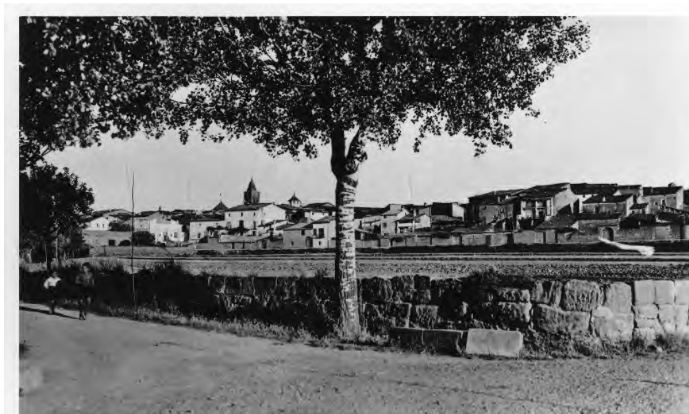
AGRAMUNT - 15

En aquestes narracions, l'escriptor visibilitza el món de la ruralia, de la Catalunya que va més enllà de la Panadella, traçant un enfilall de caricatures que volen ésser la descripció dels habitants de la població de Riella. Les principals obres que formen aquest cicle són les que es troben aplegades en el volum Memòries de Riella - Temps d'estrena, Els infants de Riella, La gent i el vent i L'arrel de panical- i l'opus magnum de l'escriptor agramuntí, La cendra .