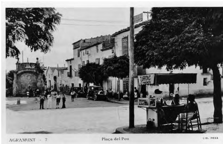
AGRAMUNT - 7