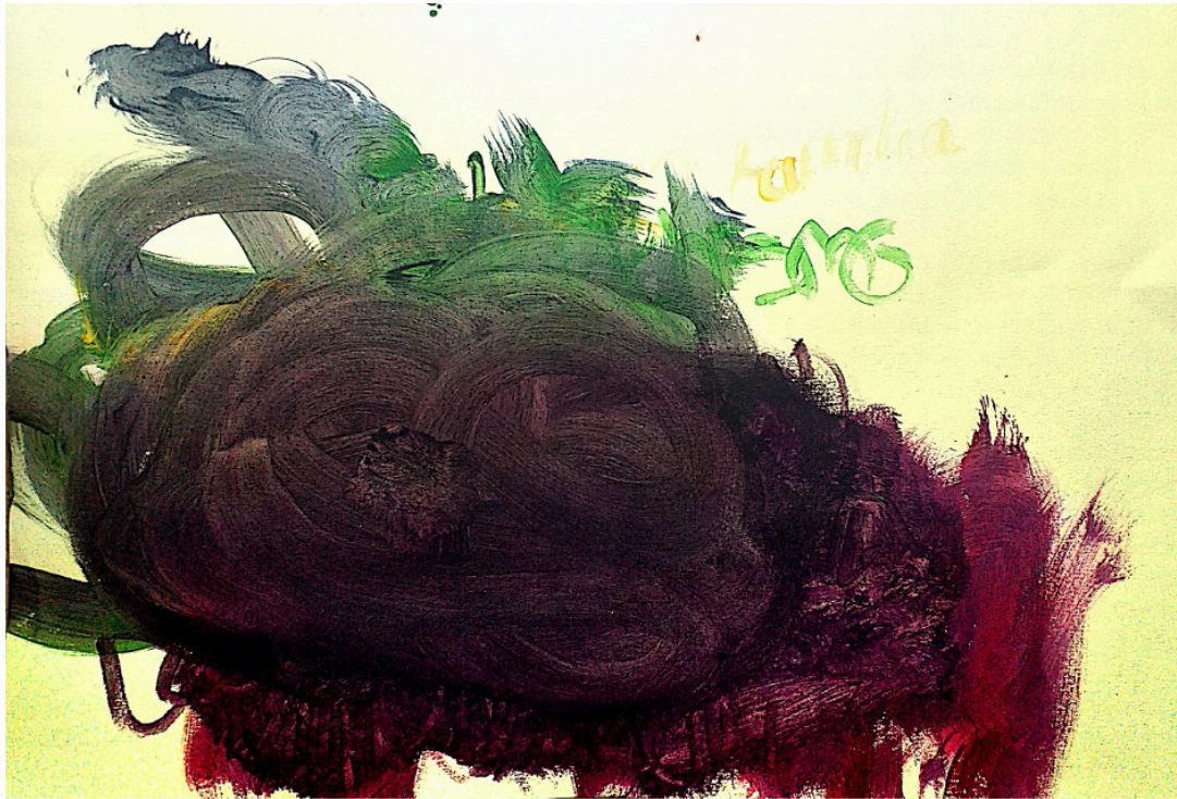
Figura 4: obra creada por Miriam, 20 años. 2020.

Esta actividad se llevó a cabo sin pretender una producción artística cualificada, sino como medio expresivo de sentimientos y emociones: