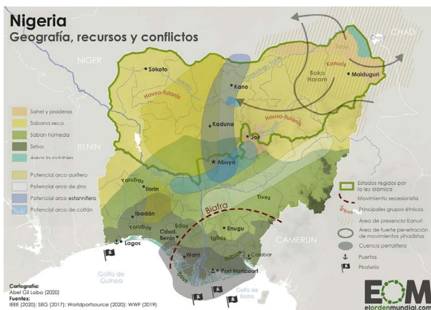
Figura 2. La geopolítica de Nigeria.

de orígenes tribales en el cual conviven más de 50 etnias y más de 250 dialectos. El norte del territorio es mayoritariamente musulmán (50 % hausa-fulanis), constituyéndose como la región más pobre y subdesarrollada. Mientras, la otra mitad del país se divide entre cristianos (40 % yarubas e igbos) y animistas (10 %) siendo la parte más poblada y que a su favor cuenta con el control de los principales recursos naturales. Sirvan de ejemplo los históricos conflictos como el separatismo de Biafra 23 , el Cinturón Medio 24 , la problemática constante del delta del Níger 25 o la corrupción arraigada del golfo de Guinea 26 .