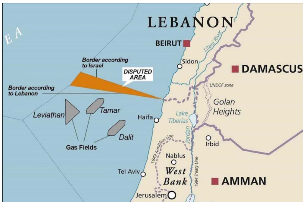
Figura 3. Área marítima en disputa entre Líbano e Israel. Fuente: MENAFM. "Lebanon, Israel sea dispute stuck over a gas field". 4/12/2021. Disponible en: https://menafn.com/1101900799/Lebanon-Israel-sea-dispute-stuck-over-a-gas-field (consultado 30/12/2021)

De la mano de Hezbolá, Irán posee una fuerte presencia en el territorio libanés. Sin embargo, las intenciones iraníes no son tan solo las de apoyar a sus correligionarios en el Líbano. Desde el punto de vista económico la existencia de un corredor que una Teherán con Beirut proporcionaría a los iraníes una ruta de comunicación hacia el Mediterráneo 24 . Además, podría prestar apoyos a la rama armada de Hezbolá, conteniendo a su rival israelí en las mismas puertas de su casa en el caso de una intervención de Israel contra Irán. Sin embargo, los iraníes deben medir sus esfuerzos en el Líbano ante un posible acuerdo en unas futuras negociaciones nucleares con los EE. UU. 25,26 .