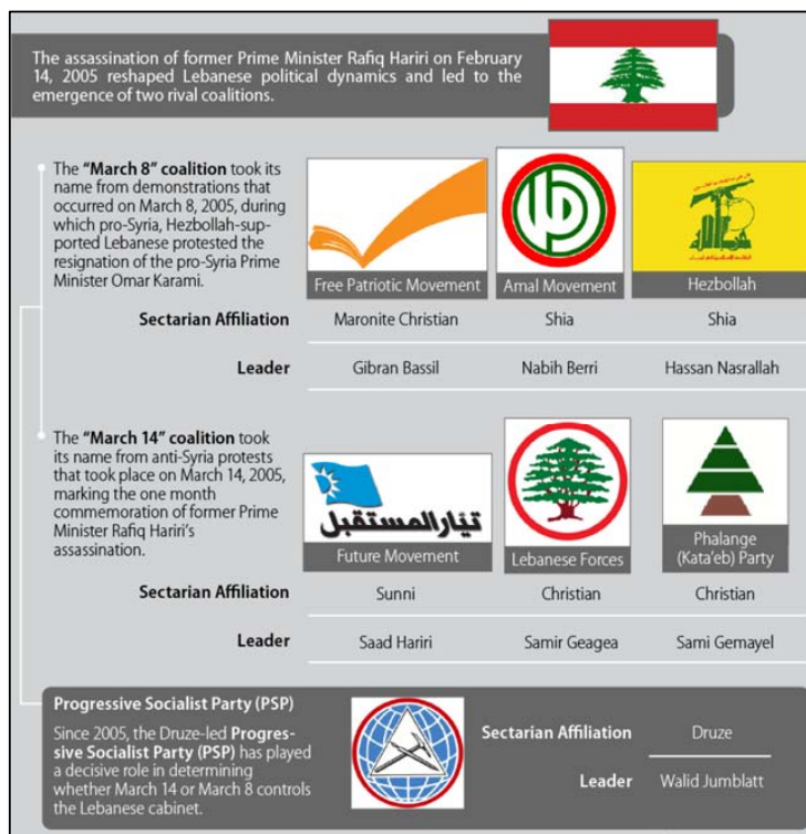
Figura 1. Principales coaliciones políticas libanesas. Fuente. HUMUD, Carla E. Lebanon. Congressional Research Service . R44759 April 21, 2021. Washington D.C. p. 7.

Por su parte Bassil posiblemente actuó presionado por Hezbolá e Irán y sus intenciones podrían haber sido allanarse el terreno para que la presidencia del próximo año recaiga sobre él. Para ello, necesitaba no enfrentarse con el resto de la clase política, que podría responsabilizarle del deterioro de la situación 5 . Además, Bassil está sancionado por la Ley Magnitsky que los EE. UU. aplican a los casos de corrupción, por lo que sus intereses se podrían focalizar más en su rehabilitación que en los problemas que pueda tener la población 6 .