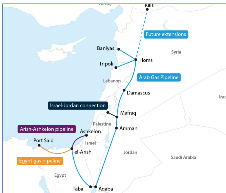
Figura 2. Situación de los gasoductos para el suministro al Líbano.

Aparte del gas israelita proveniente de Ashkelon, el norte de Jordania es abastecido desde el campo Leviathan, que pertenece a Israel. Una vez en Jordania, parte del gas se envía a Siria. Para evitar a los libaneses la vergüenza de comprar gas israelita la solución planteada sería que los sirios consumiesen el gas de Israel, mientras que su propio gas se enviase al Líbano 20 .