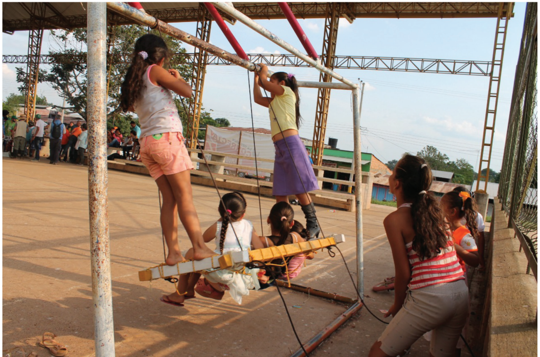
FIGURA 1. PROTOTIPO DE MÓDULO LUDOTECA PARA LA PAZ, EL CAPRICHO, IDDS 2018.