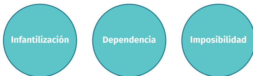
Figura 1. Principales imaginarios sociales sobre la discapacidad intelectual.

ción de verdad materializada en forma de pruebas, dónde las pruebas, pretendidamente científicas y racionales, se justifican y expresan en normas, aunque paradójicamente se asociaba la locura a “causas naturales”. El poder psiquiátrico entonces, se erige como un poder basado en un saber racional y que termina naturalizando y esencializando a un colectivo de personas. Al ser intervenidas por especialistas médicos, las personas con D.I aparecen como vulnerables, dependientes de asistencias y medicinas, y esa misma vulnerabilidad y fragilidad justificaría su dependencia de los demás.