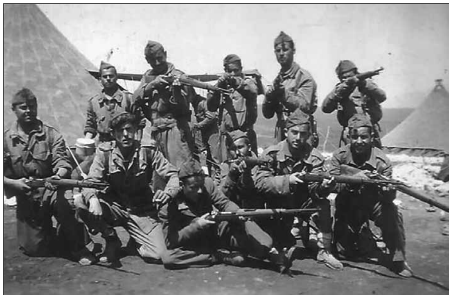
Soldados españoles en Ifni.

Finalmente, Francia concede la independencia de su zona en marzo de 1956 y pronto comienzan las huelgas y protestas en la zona española. Se producen sabotajes y manifestaciones en Tetuán, Alcazarquivir y Larache, donde asaltan el Casino Español, provocando la intervención de militares españoles que disparan y producen decenas de víctimas. Ante esta situación y el temor a un levantamiento general, en abril es España quien da la independencia a su zona norte. En cambio, la zona sur tiene que esperar a finales de 1958 para ser entregada a Marruecos.