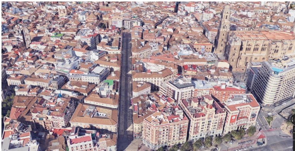
Fig.10: Vista satélite de calle Larios y su trazado rectilíneo en oposición a las sinuosas calles del Centro Histórico

Muchas propuestas de arte público no tienen nada que ver con su entorno, teniendo como una consecuencia directa que alejan al ciudadano de a pie, al local. En otros casos ocurre lo contrario, la gran mayoría del público las aprecia como ajenas a su experiencia, no les encuentra uso. Por tanto, lo común sería que tan solo sobrevive el mero goce estético cuando unos u otros son ajenos al arte público expuesto.