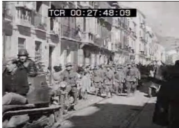
Fig.4: Desfile de las tropas italianas por calle Larios en febrero de 1937 ( https://www.youtube.com/watch?v=iPUkKV-e8gI&t=259s )

Seis años después de estos acontecimientos, ya en plena Guerra Civil, las tropas italianas enviadas a España por Benito Mussolini conquistaban la ciudad de Málaga, hasta entonces baluarte del bando republicano, para entregársela al general Franco. Los italianos conquistaron rápidamente la provincia y llegaron a la capital en febrero de 1937, desfilando triunfalmente por calle Larios una vez derrotada la resistencia. En los meses posteriores a la toma de Málaga se realizaron desfiles militares por esta vía para celebrar la victoria franquista (Villalobos, 2017).