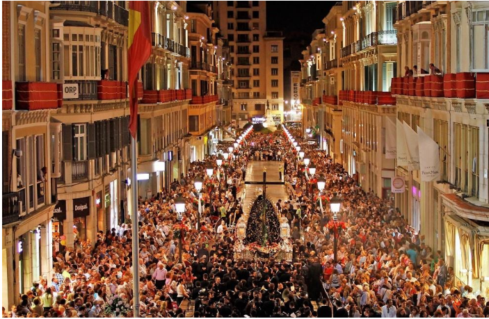
Fig.6: Procesión del Mater Dei en 2013 por calle Larios

El evento más reciente con una afluencia masiva fue la convocatoria para la huelga feminista que se celebra el 8 de marzo de cada año, destacando especialmente la de 2018, a la que acudieron unas 50.000 personas, según fuentes de la organización o 17.000 siguiendo los cálculos de Policía Nacional. (VV.AA., 2018) En el caso de 2019, la manifestación tomó un nuevo recorrido que no incluyó a calle Larios dentro de su itinerario. No obstante, en la convocatoria matutina previa a la manifestación, los congregantes sí que discurrieron por la principal calle de la ciudad (Pérez-Bryan, 2019)