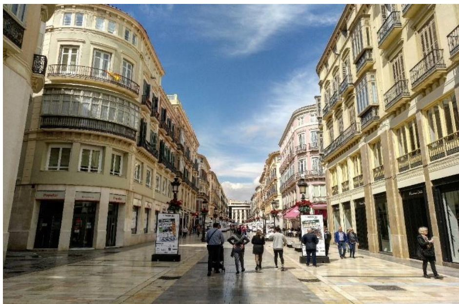
Fig.1: Calle Larios (marzo de 2019)

En un artículo reciente publicado en el diario Málaga Hoy se afirma que dos de cada tres eventos públicos celebrados en Málaga tienen lugar en el Centro Histórico, con 533 actividades entre enero y noviembre de 2018, de un total de 821 eventos admitidos en toda la Capital, lo que hace el 64'92%, a una media de 1.7 eventos diarios. Y cómo no, calle Larios se convierte en el escenario para la gran mayoría de estos actos (Sánchez, 2018). Hemos diferenciado hasta 5 tipologías de eventos principales que se celebran en la calle más importante de la ciudad, repartidos en diversas épocas del año.