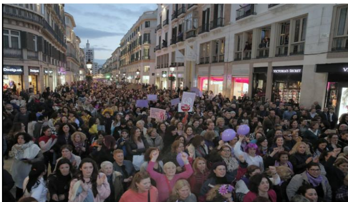
Fig.7: Manifestación del 8M 2018 en Málaga por calle Larios ( https://www.diariosur.es/malaga/directo-huelga-feminista-20180308210948-nt.html?pag=2 )