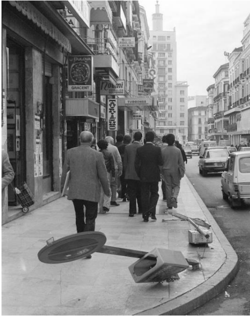
Fig.5: Calle Larios unas horas después de los altercados del 4D ( https://www.diariosur.es/malaga-capital/caparros-dias-cambiaron-20171129173526-nt.html )