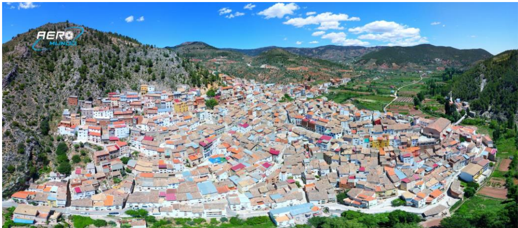
Fig. 1: Vista aérea del municipio de Bogarra, en la Comarca de la Sierra del Segura.

Dentro de la provincia manchega de Albacete (Comunidad Autónoma de Castilla-La Mancha, España) se sitúa, en la Comarca de la Sierra del Segura, la localidad de Bogarra (Fig.1). Un pequeño municipio, de origen íbero, que queda entablado a un lado de la imponente mole rocosa del Cerro del Padrastrero (1.500 m.), contando con poco más de 800 habitantes 2 .