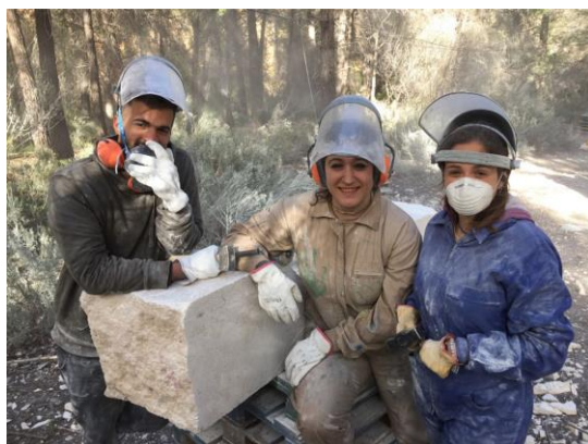
Fig. 6: Alumnado de la Facultad de Bellas Artes de Altea (UMH) en el Certamen de Escultura de Bogarra. Imágenes de los autores (2019).