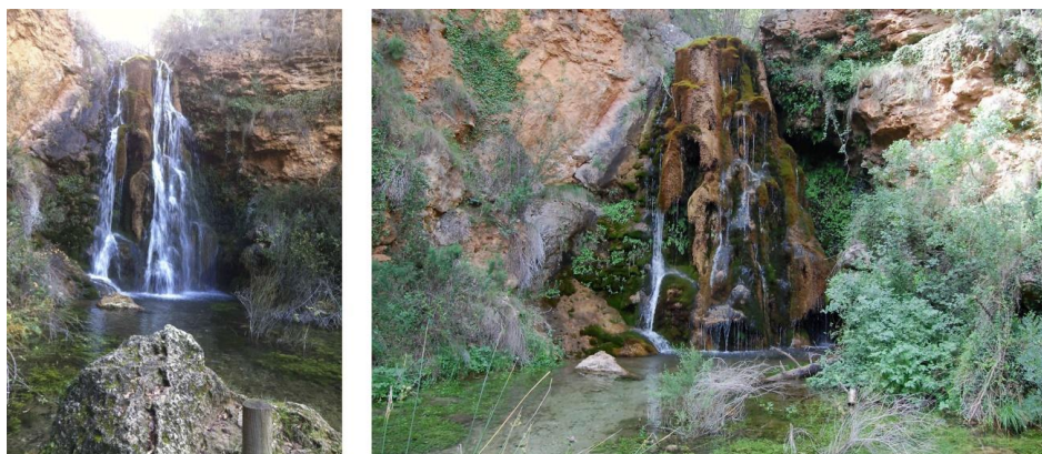
Fig. 2: Cascada del batán (Bogarrra, 2019).

Sus calles, antiguas y empinadas, conservan el carácter serrano de estas tierras, mostrando en cada recodo un elemento popular, desde las galerías a las paredes que se levantan en la roca viva, de fuerte tradición árabe, que invitan al visitante a adentrarse por ellas y descubrir rincones de gran belleza.