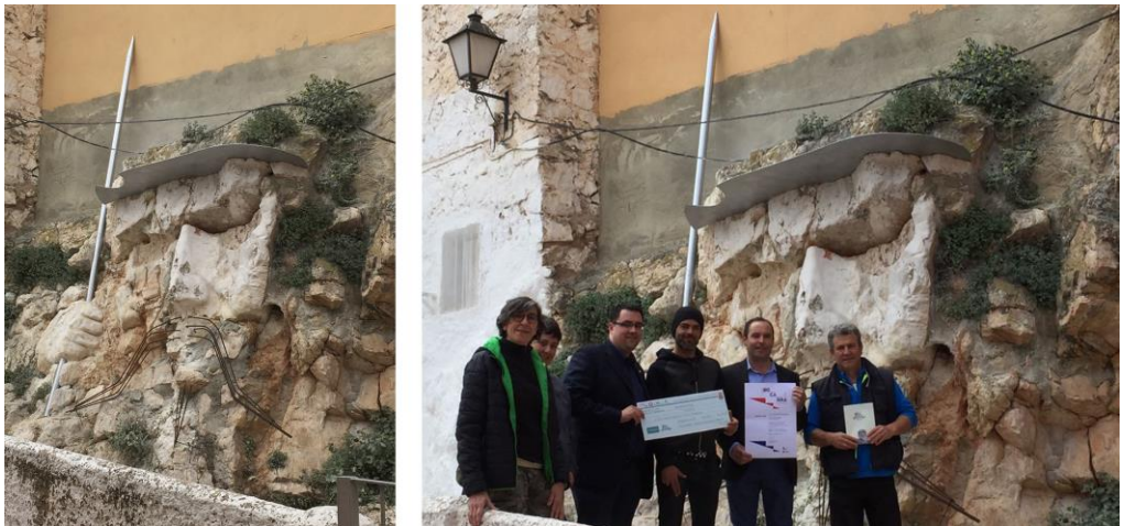
Fig. 9: Intervención escultórica “Al Quijote. R1” del artista José F. García Chuecos / Entrega de premio. (Fuente: autores, 2019).