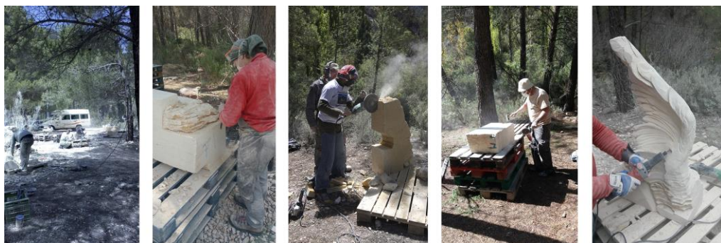
Fig. 5: Zona de trabajo y participantes en el desarrollo de realización de sus piezas. Ruta de las Esculturas en Bogarra. Imágenes de los autorres (2019).