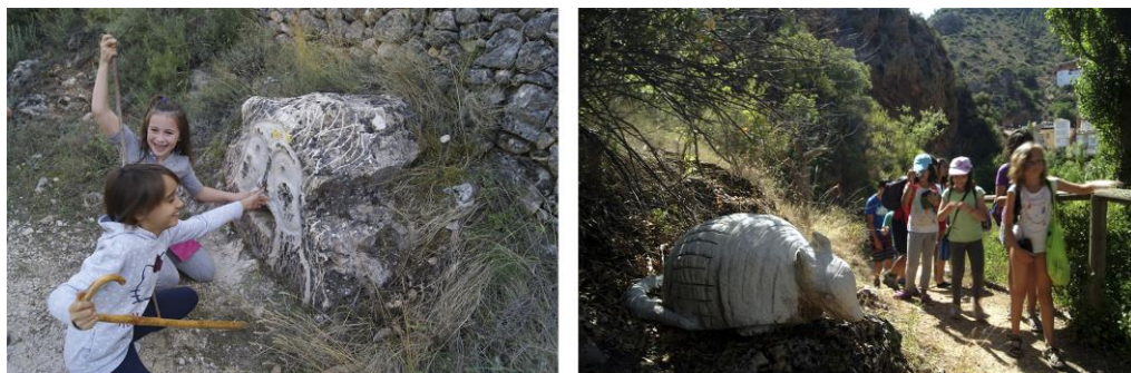
Fig. 4: Experiencia del trayecto a partir de niños en familia o como actividad escolar. Senda Digital “Rutas-juego para familias sobre la naturaleza, Historia y tradiciones de la Sierra del Segura de Albacete” / Bogarra, la sonrisa serrana “Ruta de las esculturas”. https://www.senderismo.net/destino/albacete/senda-digital https://bogarraturismo.com/2017/04/08/ruta-de-las-esculturas/

la montaña), cuya producción y obra queda instalada a lo largo del sendero que transcurre desde Bogarra por la orilla del río, aguas arriba. De este modo, se conforma un sendero artístico-cultural, emplazado en la misma naturaleza, que por sus propias características geográficas es un trayecto idóneo para el disfrute turístico, sobretodo el de tipo senderismo familiar (Fig. 4), ya que es ideal para los niños, pues a lo largo de su transcurso, pueden dejar volar su imaginación al hilo de las figuras que salen a paso sin que el propio terreno suponga apenas dificultad para su experiencia completa.