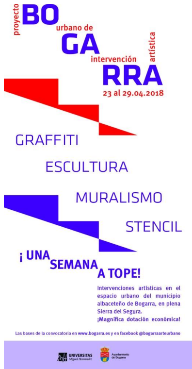
Fig. 7: Cartel del Proyecto Urbano de Intervención Artística.

En la misma, desarrollada durante el mes de mayo del 2018, artistas de diferentes países, así como colectivos artísticos nacionales e internacionales, presentaron diversas propuestas de intervención que han dotado a la misma, a través del graffiti, estencil, muralismo, talla y técnicas mixtas de una importante calidad interdisciplinar.