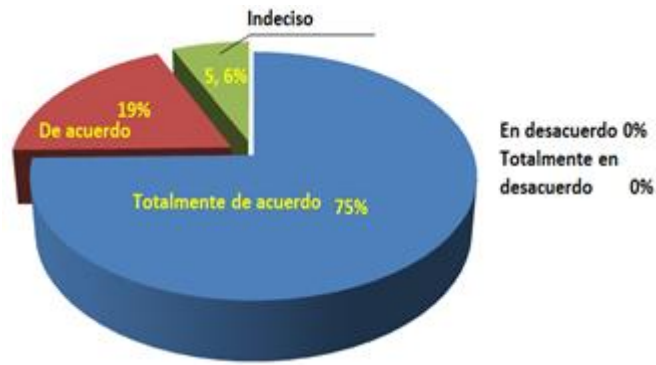
Figura 3. Amabilidad del personal técnico de la clínica veterinaria

Respecto a la rapidez del servicio de veterinaria con relación a los pacientes que llegan a la clínica (figura 4), se tiene que el 75% de los sujetos refiere estar totalmente de acuerdo, mientras que el 19% está de acuerdo y solamente el 5,6% dice estar indeciso. Por lo que se evidencia un buen servicio.