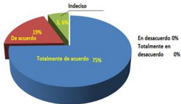
Figura 4. Rapidez del servicio de veterinaria con relación a los pacientes que llegan a la clínica.

Respecto a la rapidez del servicio de veterinaria con relación a los pacientes que llegan a la clínica (figura 4), se tiene que el 75% de los sujetos refiere estar totalmente de acuerdo, mientras que el 19% está de acuerdo y solamente el 5,6% dice estar indeciso. Por lo que se evidencia un buen servicio.