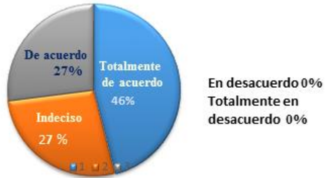
Figura 1. Funciones principales en el desarrollo diario del trabajo

En la figura 2 se puede observar la necesidad de un manual de procesos y procedimientos para alcanzar los niveles óptimos de eficiencia y eficacia para que la clínica veterinaria pueda funcionar de mejor manera donde visiblemente evidencia que es necesaria la aplicación de un manual de procesos y procedimientos, pues el 87% de los sujetos encuestados se encuentra totalmente insatisfactorio y solamente el 13% es parcialmente satisfactorio.