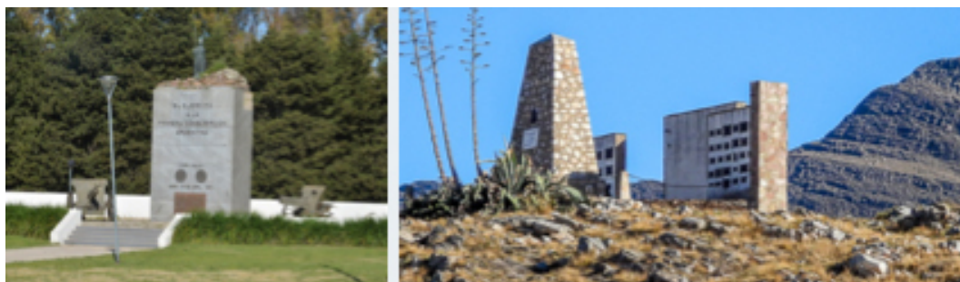
Figura IV. Monumentos a la Primera Conscripción Argentina.