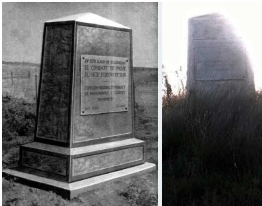
Imagen de la izquierda extraída de Monferrán Monferrán (1962) e imagen de la derecha obtenida de https://semreflejos.com.ar/asi-esta-el-monolito-que-recuerda-la-batalla-de-pi-hue/