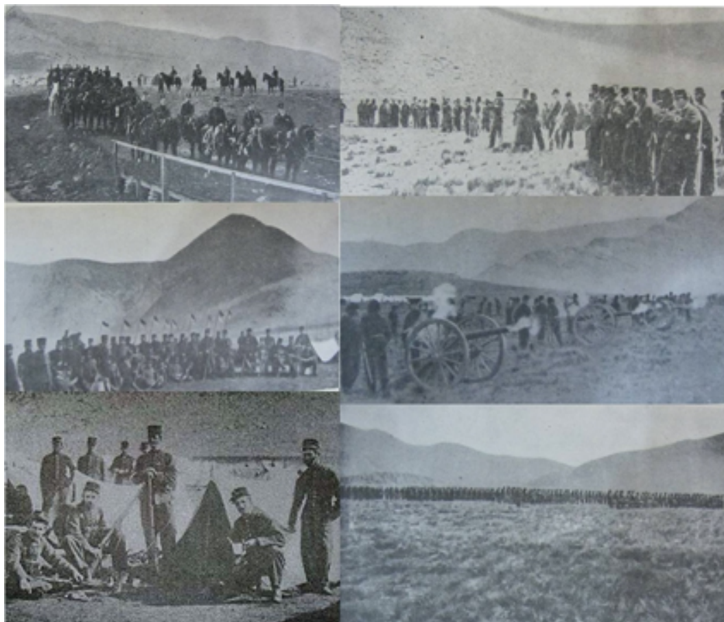
Figura V. Diversas imágenes de la Primera Conscripción Militar de 1896 en Curamalal, próximo a Pigüé.

Imágenes extraídas de Monferrán Monferrán (1955) y del Archivo General de la Nación.