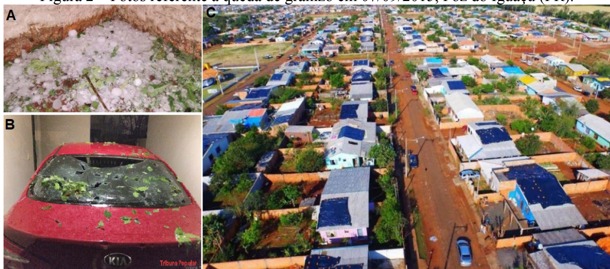
Figura 2 – Fotos referente a queda de granizo em 07/09/2015, Foz do Iguazu (PR).