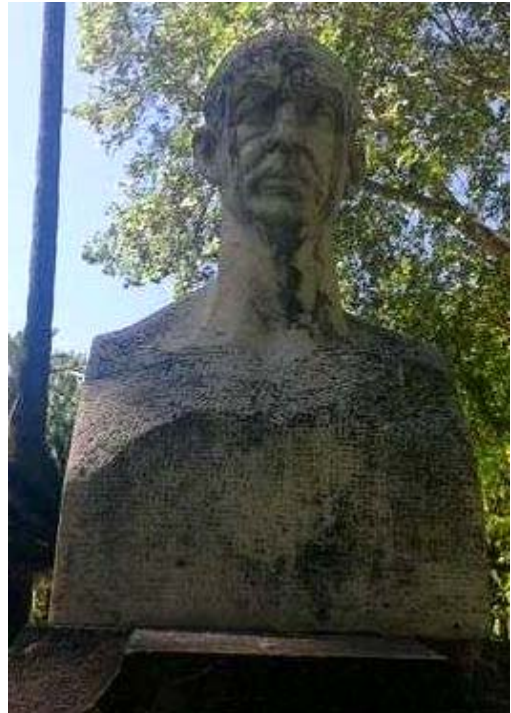
Fig. 5. Busto al músico Cipriano Martínez Rucker (1924)

En lo que atañe al busto de Pablo Iglesias, la distancia que lo separa del busto dedicado a Manuel Reina es de un año, pertenece a la misma tipología y se desarrolla en el mismo contexto, Puente Genil durante la II República. Todos estos datos contribuyen a conocer la manera en la que Moreno llevó a cabo estos encargos, significativos de las medidas empleadas por los ayuntamientos republicanos durante este periodo, que de forma paulatina engalanaron el espacio público de sus municipios con monumentos en homenaje a los principales exponentes culturales y políticos de la época.