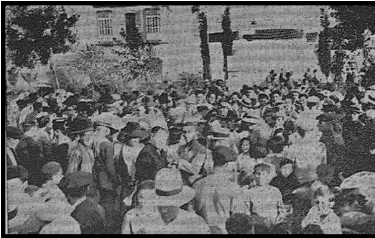
Fig. 2. Inauguración del busto a Pablo Iglesias en Puente Genil (1932), imagen cedida por Diego Igeño.

tarde, los agentes políticos referidos se trasladaron al estadio municipal de fútbol donde se colocaron para la ocasión unas tribunas adornadas con banderas socialistas, en vistas a la celebración de un mitin. Intervino de nuevo Gabriel Morón, que en esta ocasión ensalzó la labor del Partido Socialista en la salvación de la República. Seguidamente, intervinieron Luis Prieto (1904-1948), Miguel Ranchal (1902-1940) 18 , diputado provincial de Córdoba y por entonces alcalde de Villanueva del Duque, así como José Ruiz del Toro (1903-1957), diputado por la provincia de Murcia. Más tarde, al término del acto, concurrido este con gran entusiasmo, los asistentes fueron obsequiados con un banquete 19 .