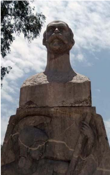
Fig. 4. Busto al poeta Manuel Reina (1933), fotografía: Rubén Serrano Ruz.

Después de atender a estos parámetros, y pese a que la distancia temporal con respecto a la realización de ambos bustos es de nueve años, el tamaño es coincidente, lo que hace pensar en un posible criterio unitario, mantenido en el tiempo, a la hora de afrontar el trabajo de piezas con carácter conmemorativo.